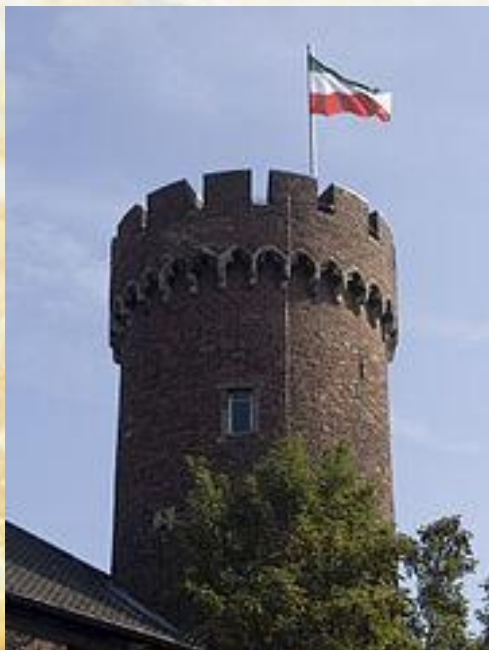
Донжон Кемпенского замка

Главной частью средневекового замка являлась центральная башня — донжон