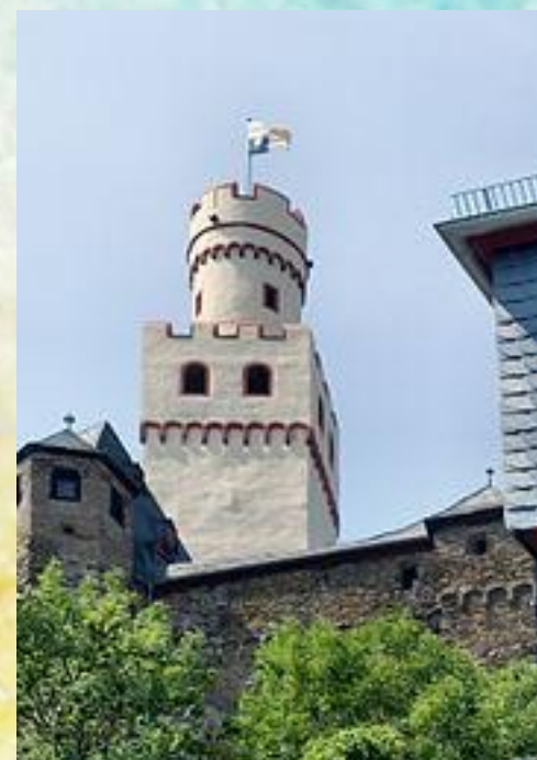
Донжон замка Марксбург