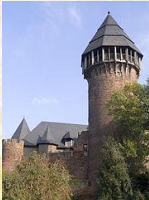
Донжон замка Бург Линн