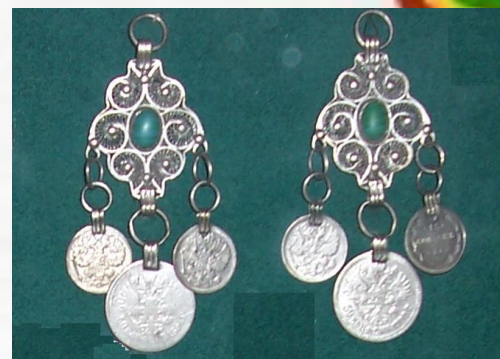
Алкарар - серьги