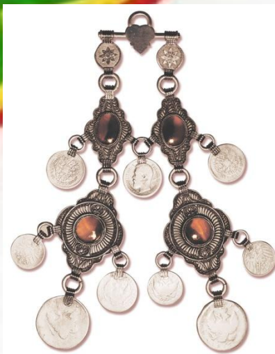
Чуллы – украшение для кос