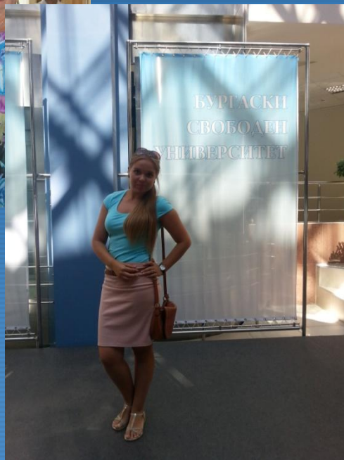
Бургаский свободный университет, г. Бургас