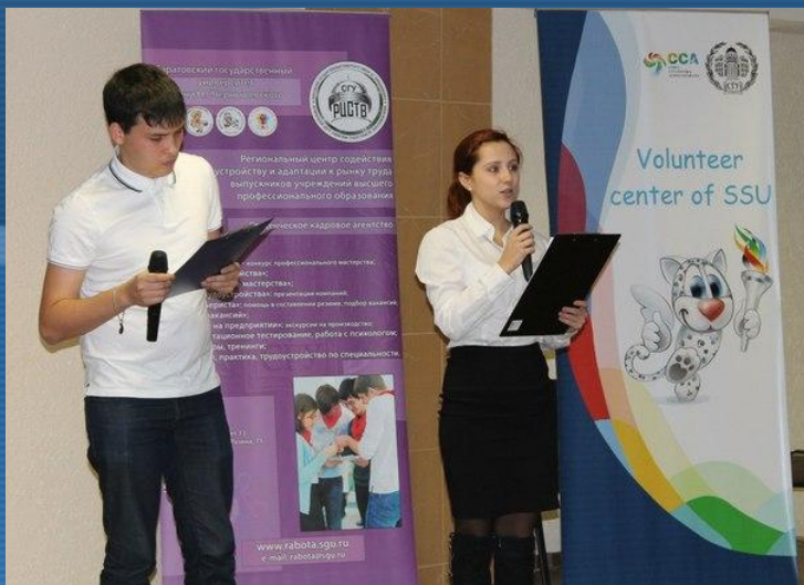
Всероссийский слёт СКА, г. Саратов, 2013г.