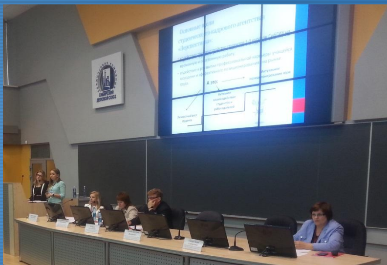
Форум «Работающая молодежь Кузбасса», 2014 г.