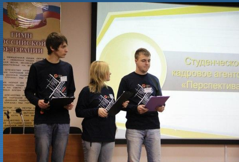
Защита проекта СКА «Перспектива» на программе Студенческие инициативы «Полюс Золото-CAF», 2013г.