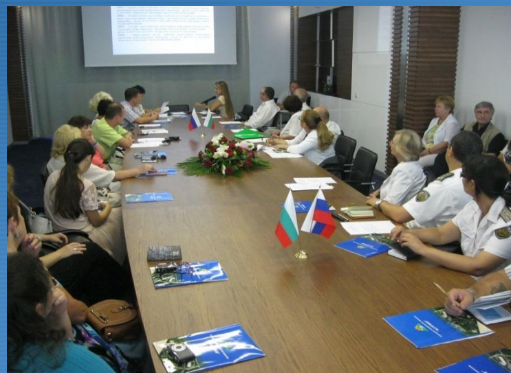
Международная летняя школа «Успешная карьера», Болгария, 2014г.