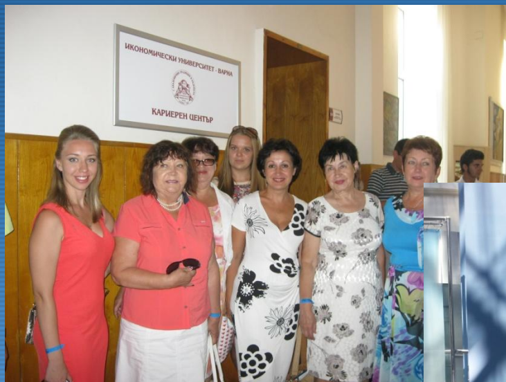
Экономический университет, г. Варна