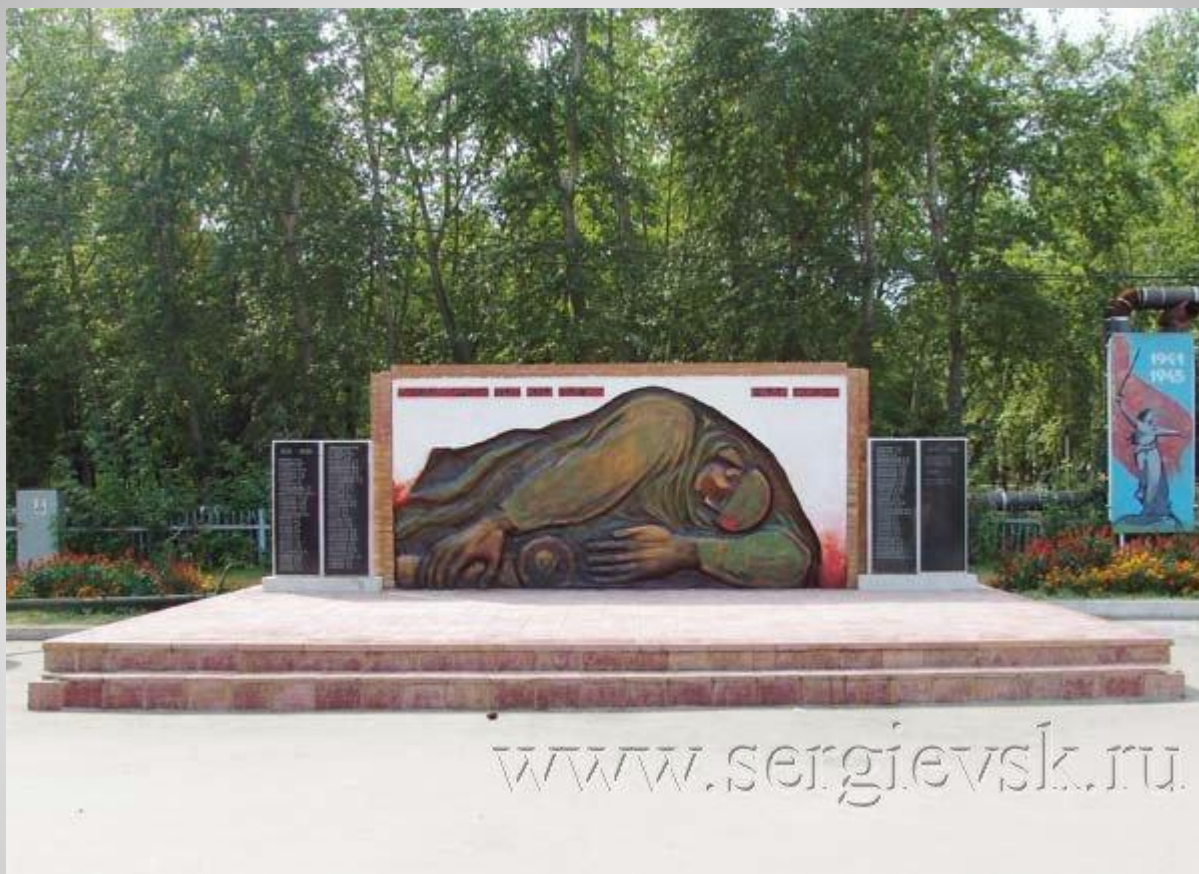
Памятник неизвестному солдату