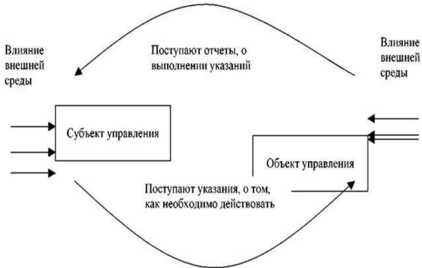
Рис. 2. Укрупненная структура системы управления