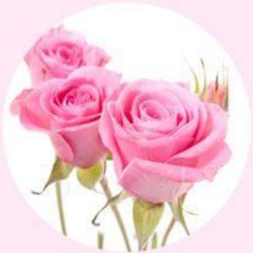
"Twinkle Bride" Spray Rose