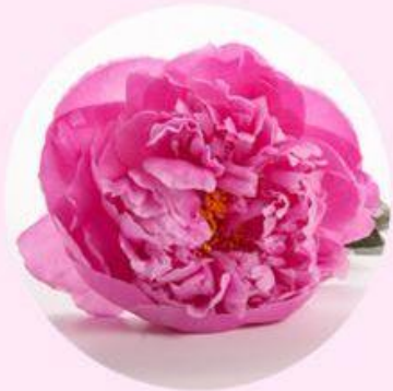
"Alex Fleming" Peony