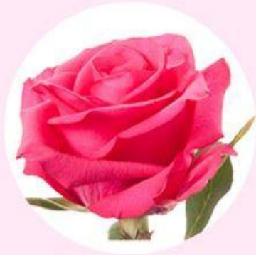
"Hot Paris" Rose