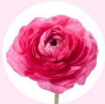
Hot Pink Ranunculus