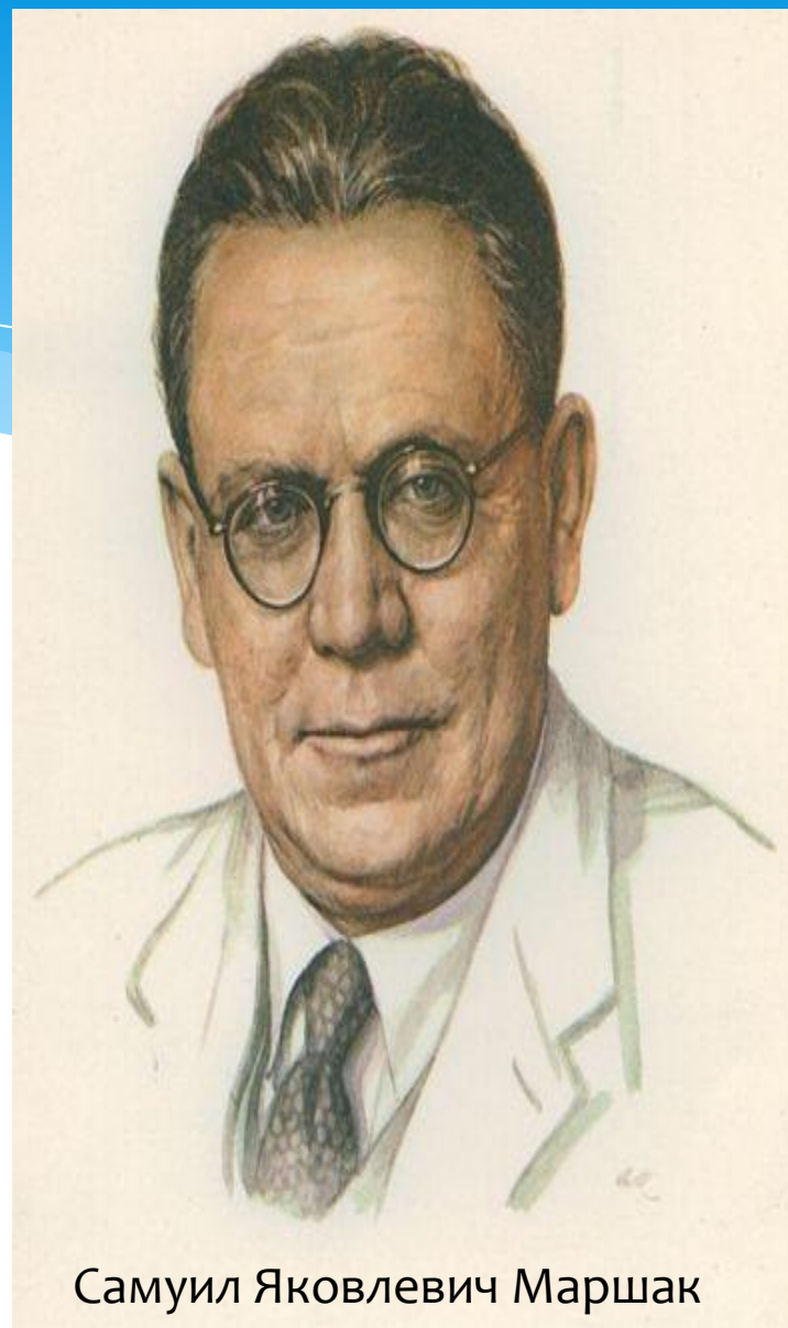
Самуил Яковлевич Маршак

В 1943 году создает пьесу-сказку «Двенадцать месяцев». Она написана по мотивам словацкой народной сказки о девочке, которая накануне Нового года встретила одновременно двенадцать месяцев. Но Маршак не только пересказал сюжет сказки, а расширил его.