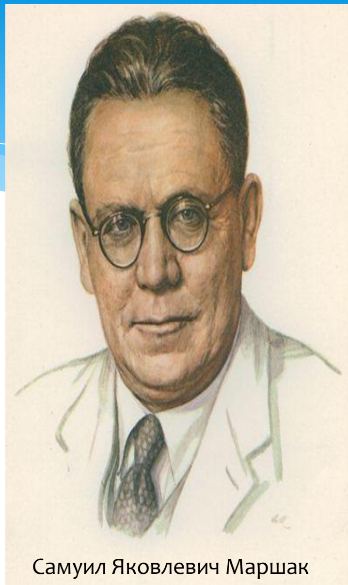
Самуил Яковлевич Маршак

В 1943 году создает пьесу-сказку «Двенадцать месяцев». Она написана по мотивам словацкой народной сказки о девочке, которая накануне Нового года встретила одновременно двенадцать месяцев. Но Маршак не только пересказал сюжет сказки, а расширил его.