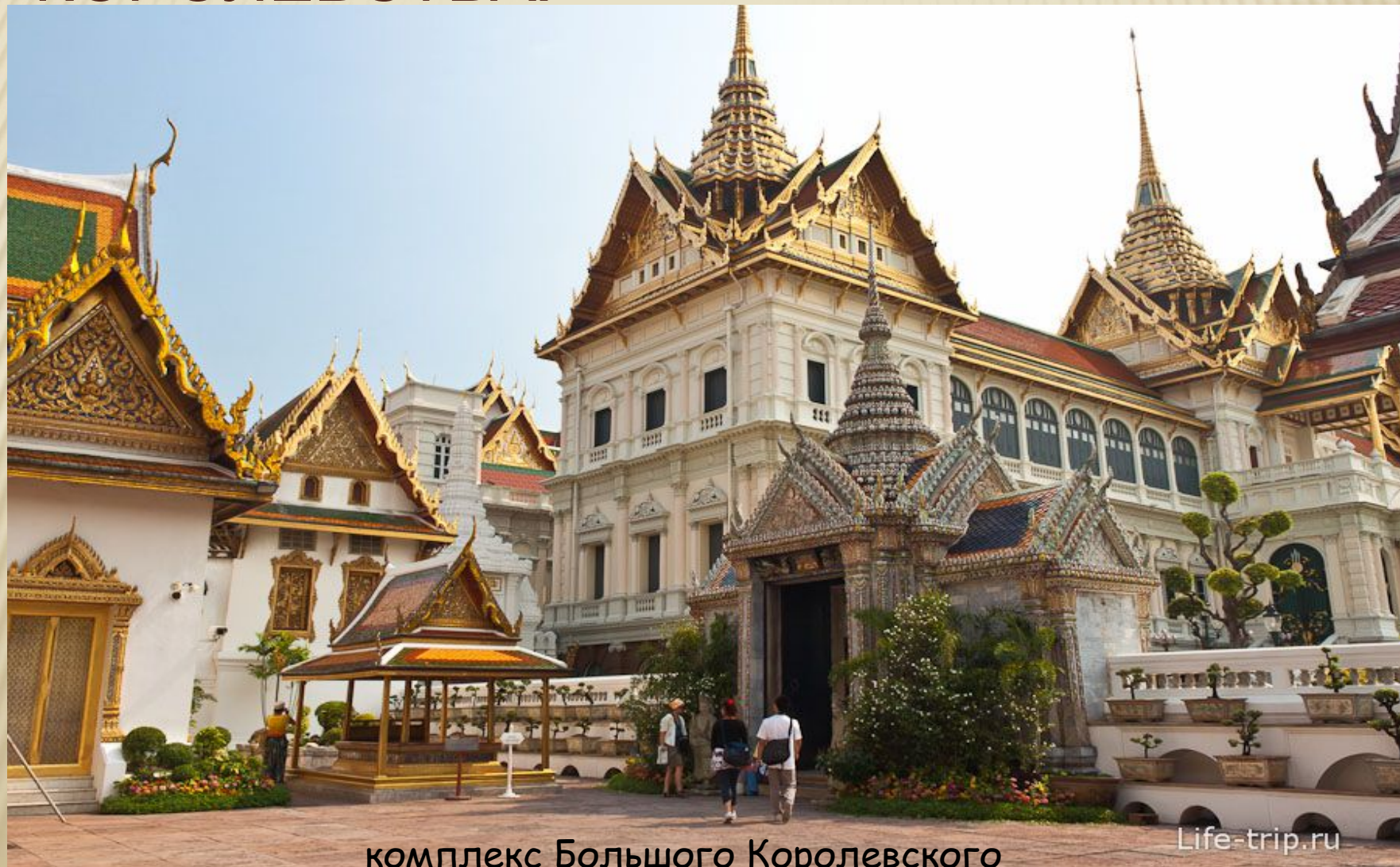
комплекс Большого Королевского Дворца;