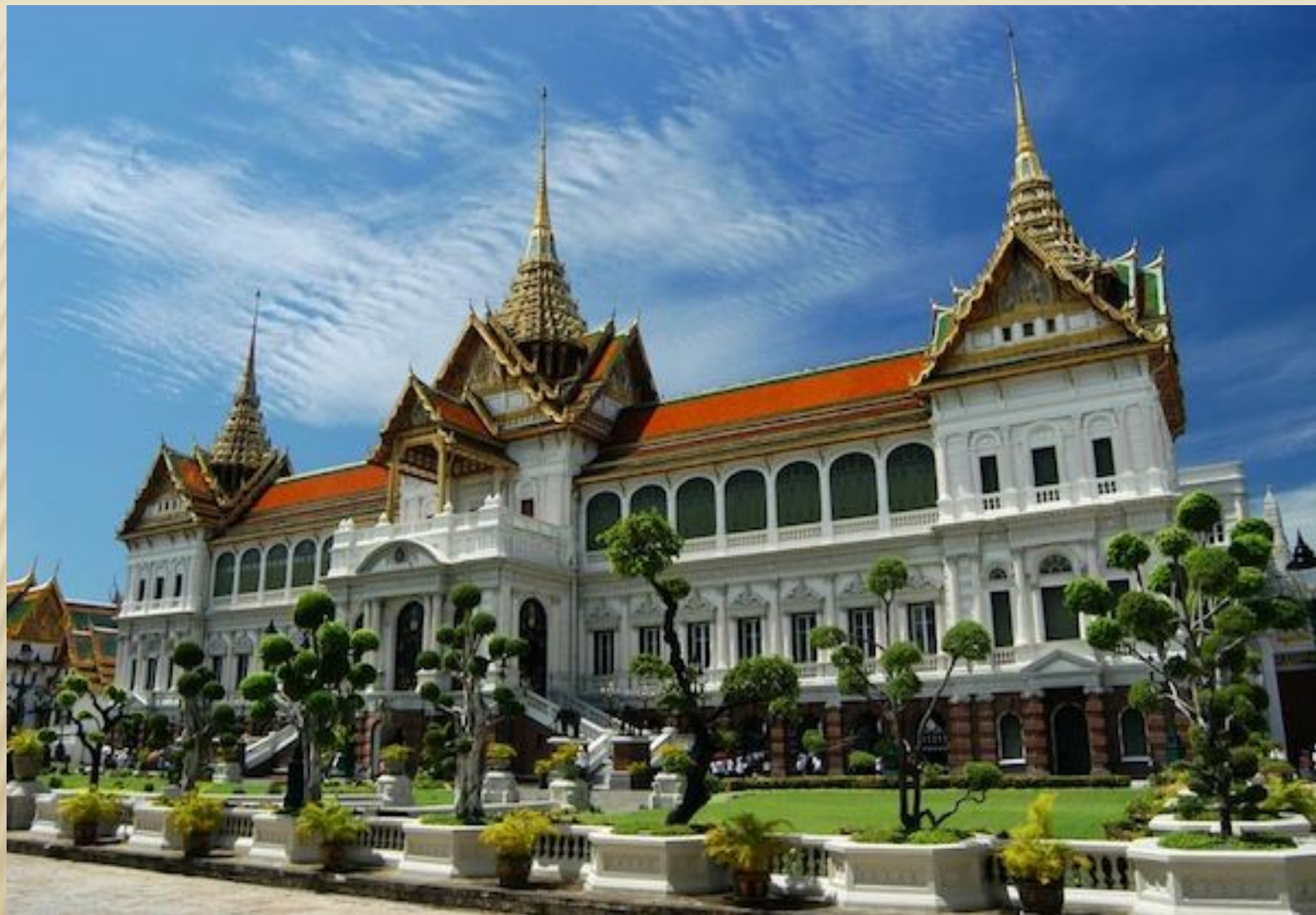
Королевский дворец -1785 г.