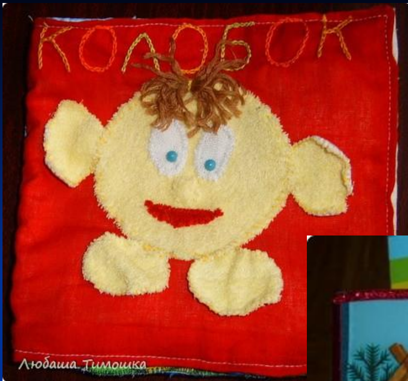
Мягкая книжка «Колобок»