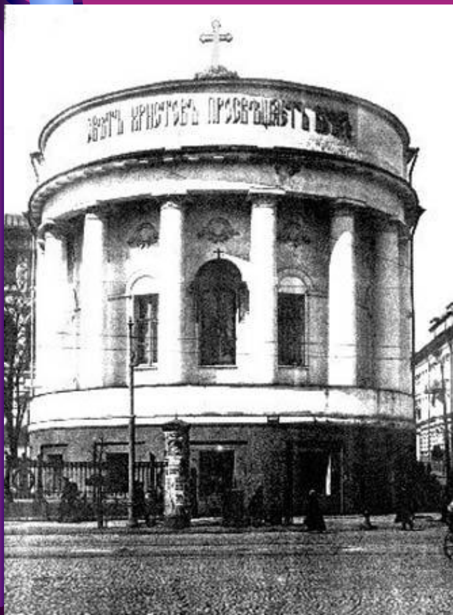
Домовая церковь Московского Университета