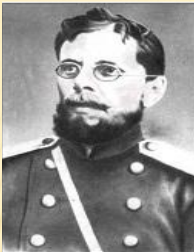
Иван Алексеевич Куратов