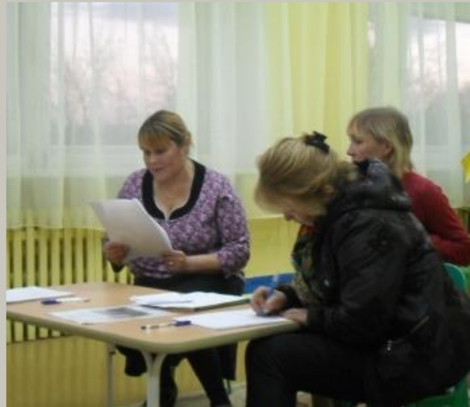
Оглашение решения собрания