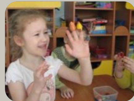
Театр на руке (пальчиковый)