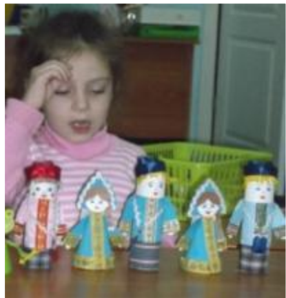
Настольный кукольный театр