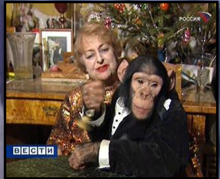
Наталья Юрьевна Дурова