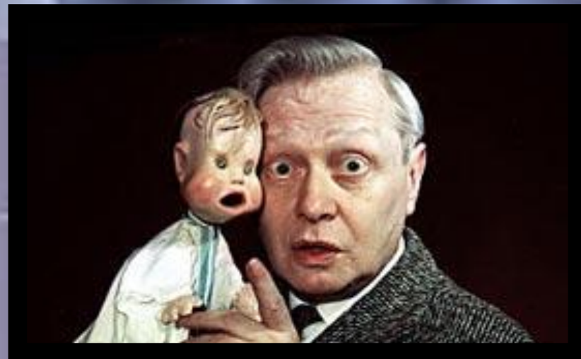
Сергей Владимирович Образцов

ГОСУДАРСТВЕННЫЙ АКАДЕМИЧЕСКИЙ ЦЕНТРАЛЬНЫЙ ТЕАТР КУКОЛ С.В. ОБРАЗЦОВА