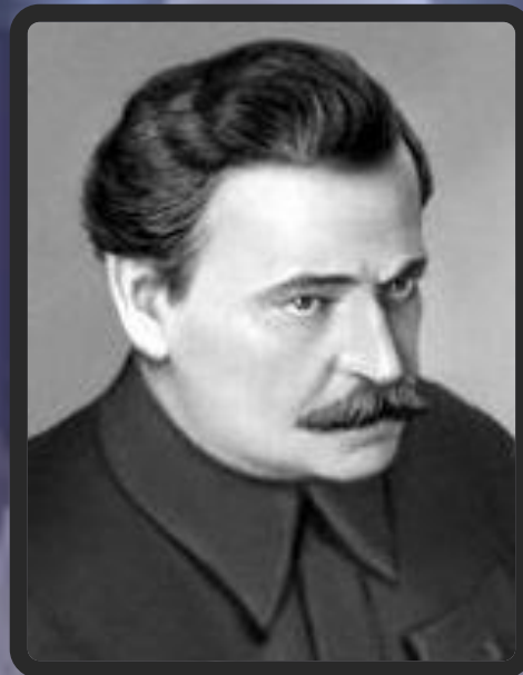
Владимир Леонидович Д