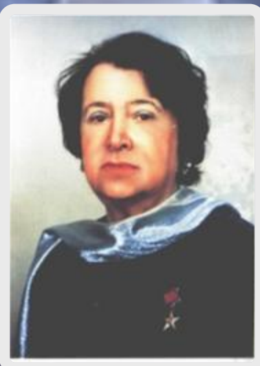
Наталья Ильинична Сац