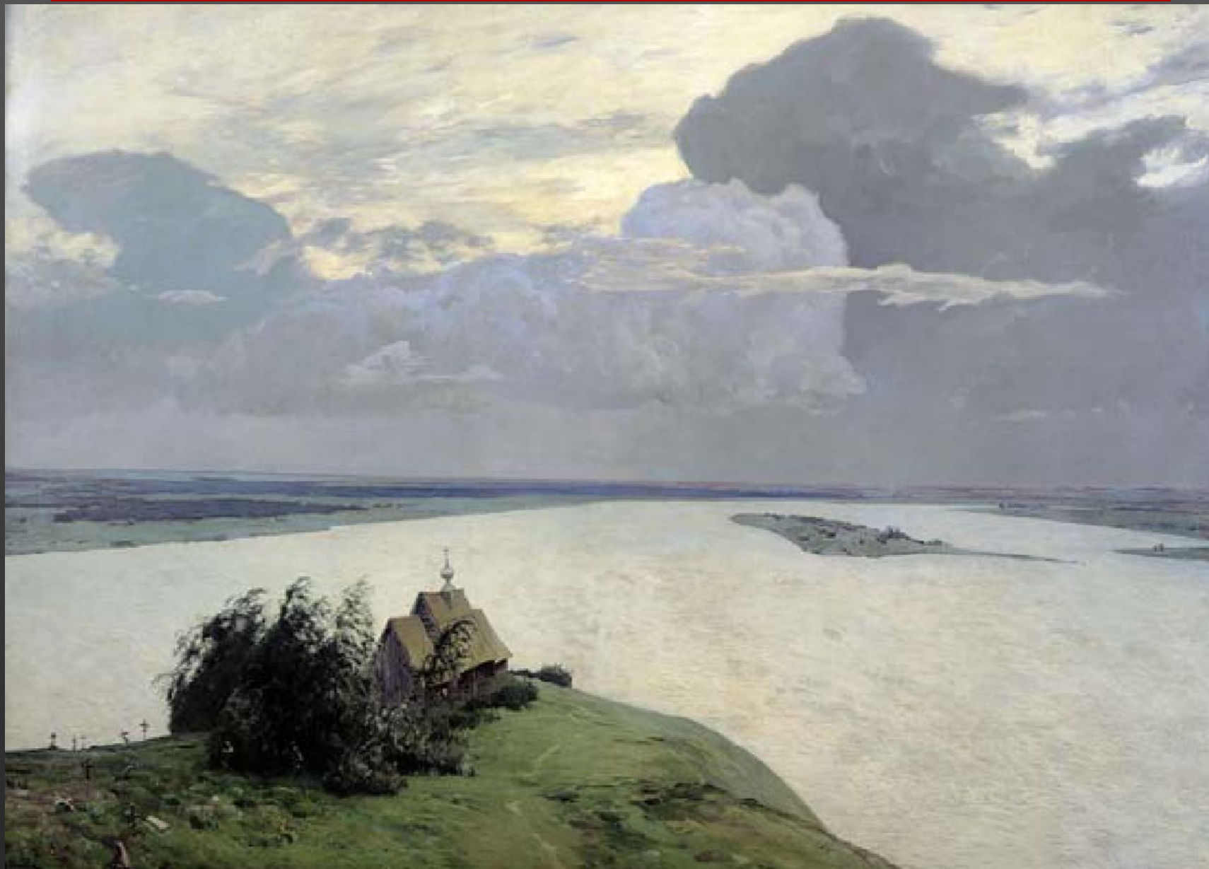
4. Исаак Левитан. Над вечным покоем. 1894