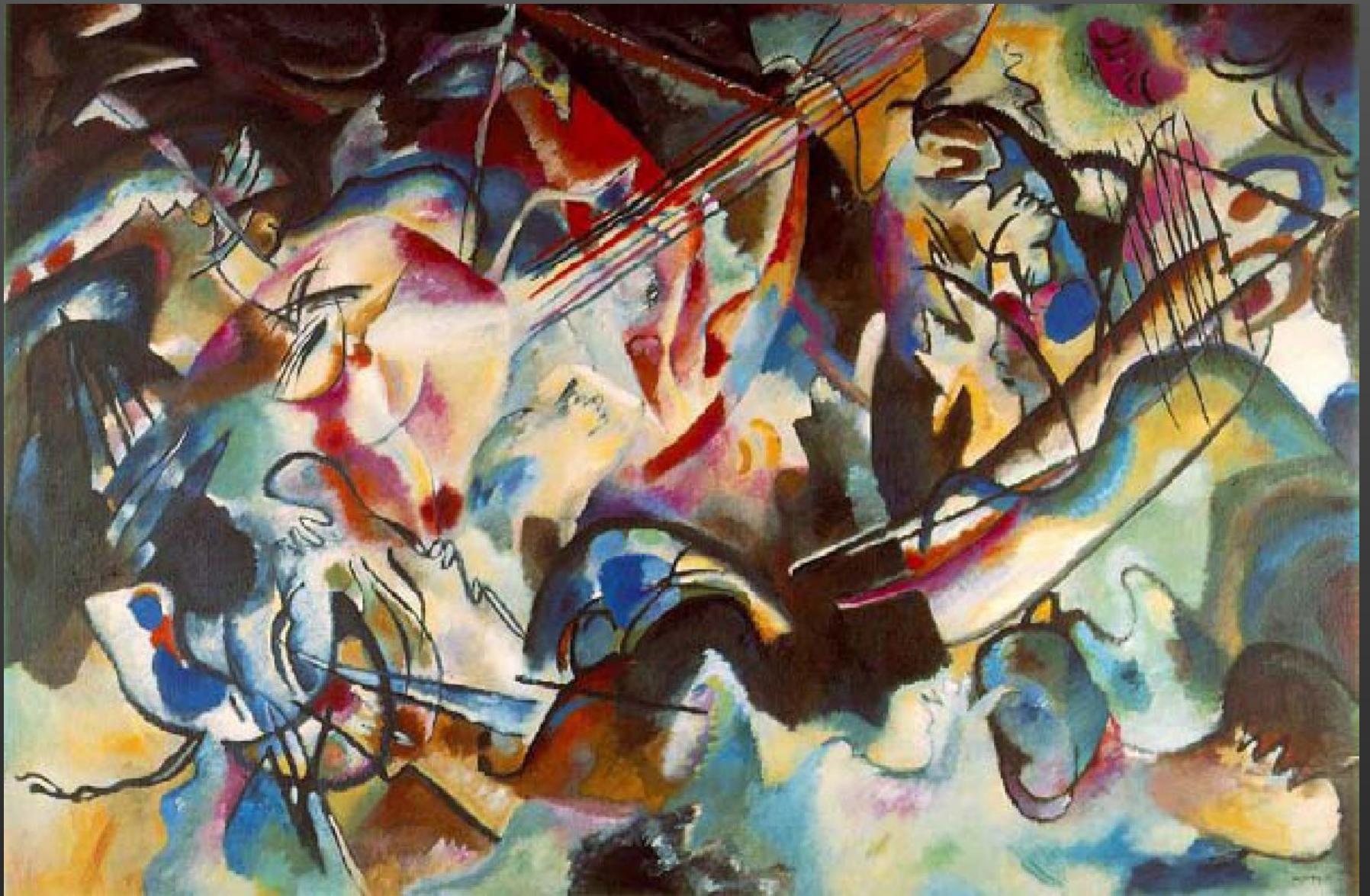
1. Василий Кандинский. Композиция VI. 1913