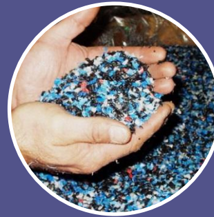
Вторинне використання відходів