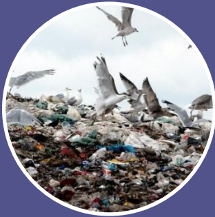
Поховання на смітниках