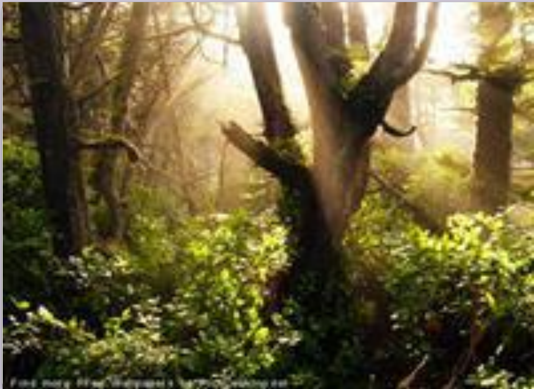
Forest scene with sunlight filtering through the trees.