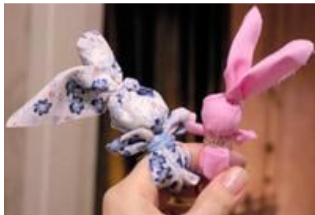
Кукла на пальчик