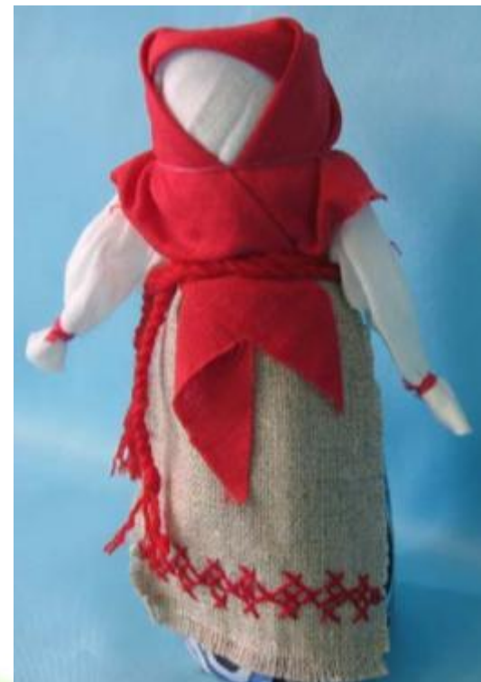
Кукла - закрутка