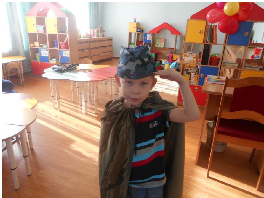
Сюжетно-ролевая игра «Солдат на посту»