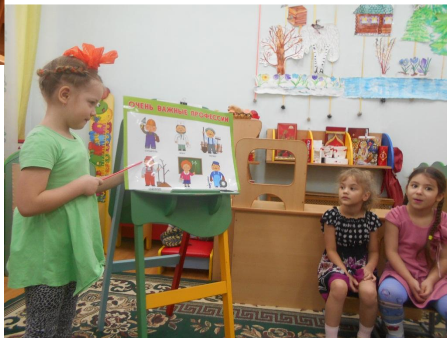
Сюжетно- ролевая игра «Воспитатель»