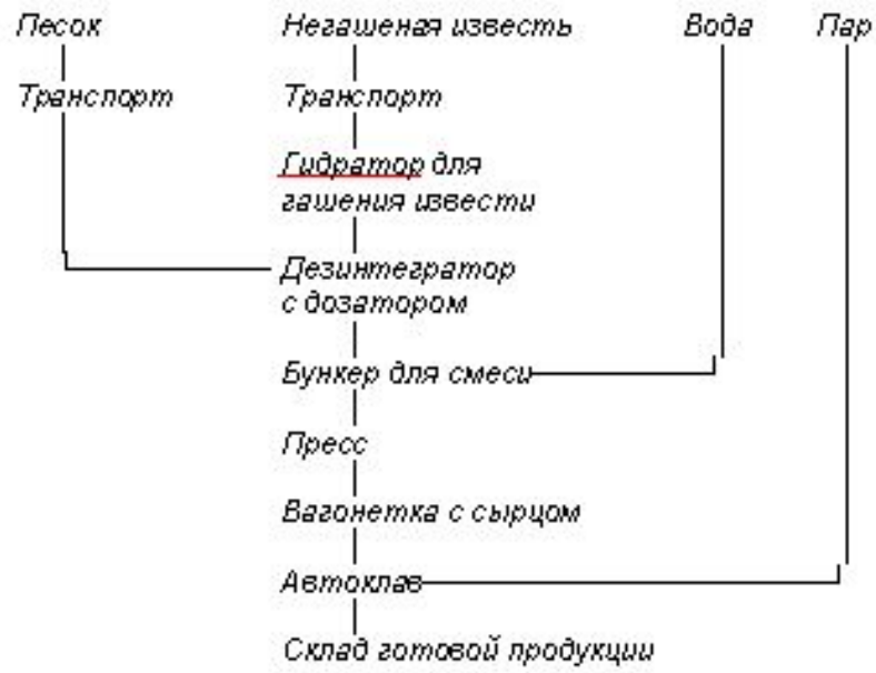
Рис. 3. Технологическая схема производства силикатного кирпича дезинтеграторным способом.