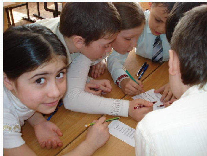
групповая работа (большие группы)