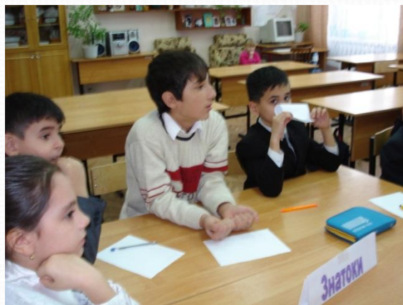
групповая работа (малые группы)