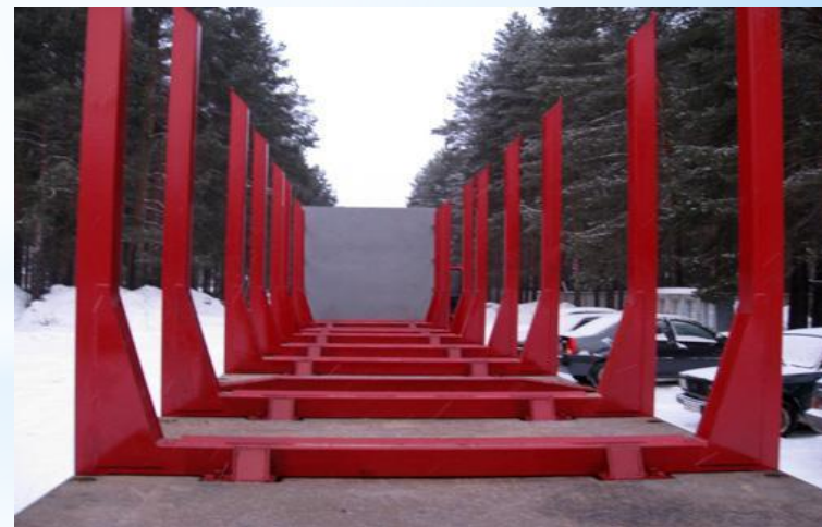
Платформа с 6 кониками и передним щитом