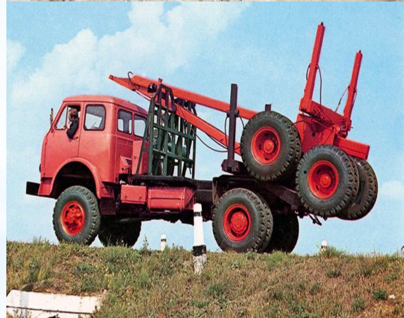
Прицеп –роспуск в транспортном положении