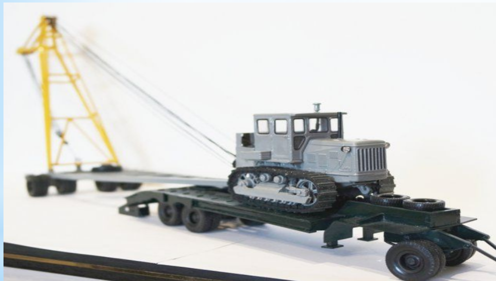
Т-108 трактор + кран тракторный прицепной КП-25

На труднодоступных участках трассы используют автопоезда с автомобилями МАЗ для перевозки секций.