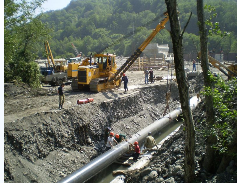
Строительство газопровода в горном кластере

При затяжных подъемах трактор используют как дополнительный тягач. При этом буксирный трос крепят одним концом к трактору, а другим концом к буксирному крюку гружёного автомобиля.