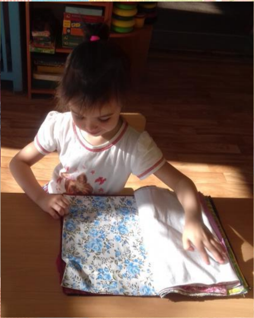
Альбом «Ткани ХБК»