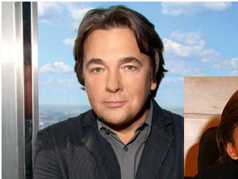
Константин Эрнст — генеральный директор.