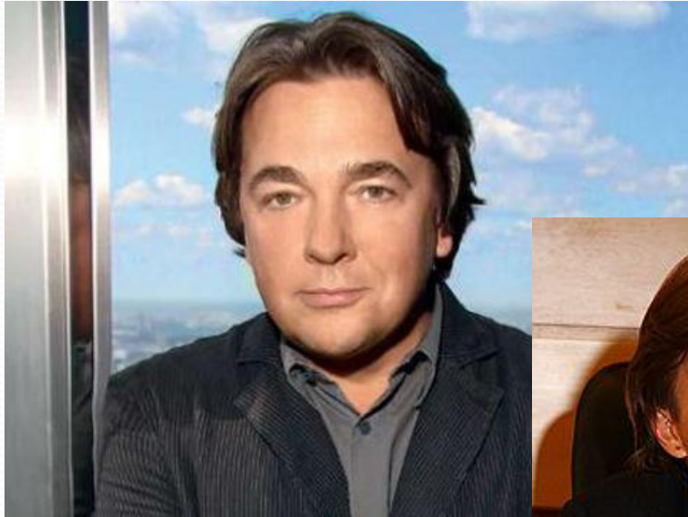
Константин Эрнст — генеральный директор.