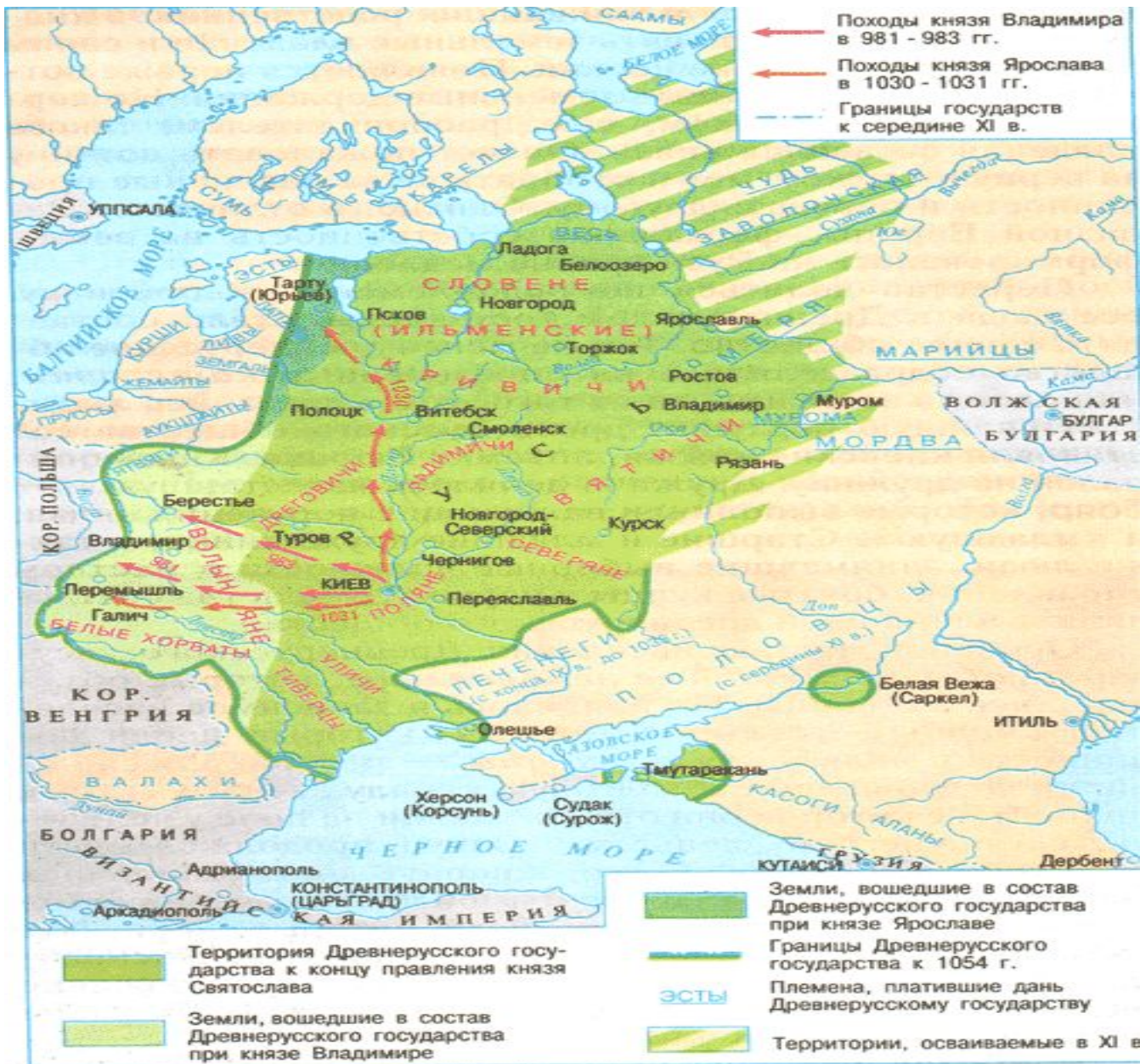
Русь в X — начале XII века.