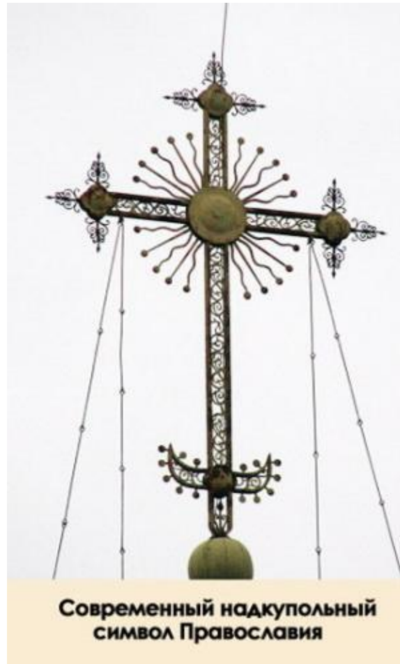
Современный надкупольный символ Православия