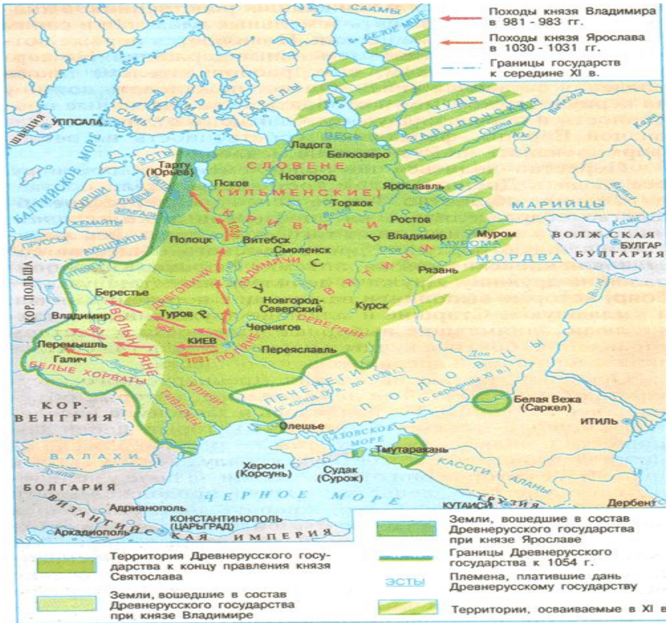
Русь в X — начале XII века.