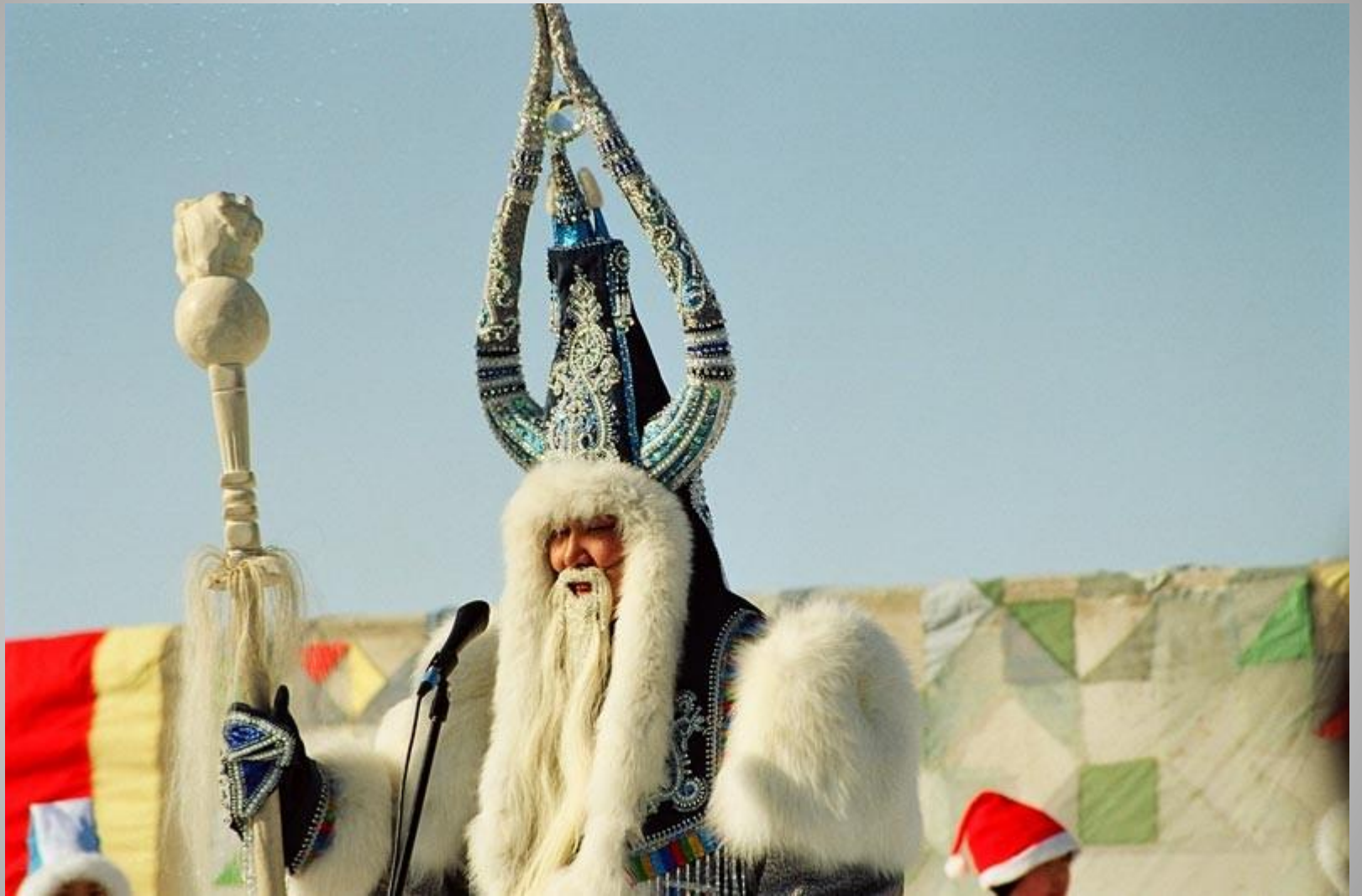
Якутский Дед Мороз Чисхан