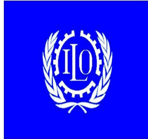
Международная Организация Труда (МОТ)