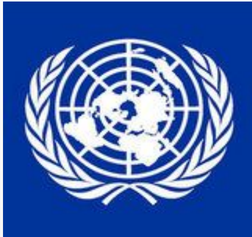
Организация Объединенных Наций (ООН)

Международное регулирование труда осуществляется на двустороннем, региональном, общемировом уровнях. Важную роль в органах международного регулирования труда занимают: Организация Объединенных Наций (ООН), Международная Организация Труда (МОТ).