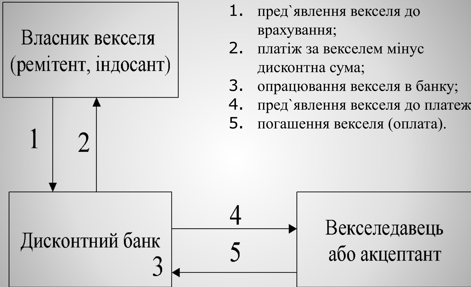
Схема врахування векселя з погашенням у банку