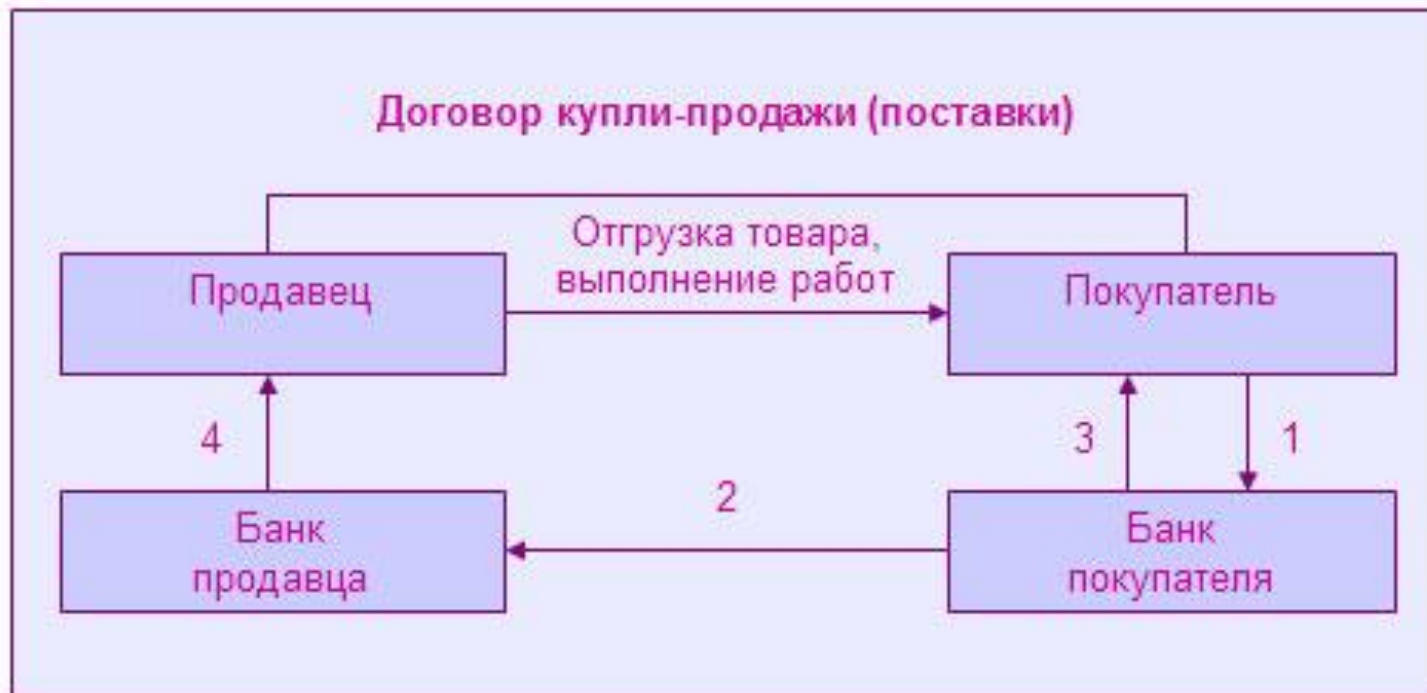
Схема расчетов платежными поручениями

1 — выписка платежного поручения в соответствии с требованиями договора