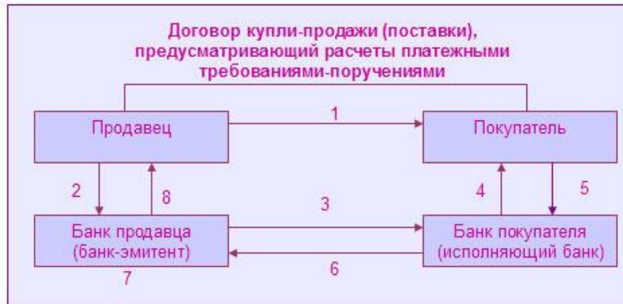
Схема расчетов с использованием платежных требований-поручений, подлежащих акцепту плательщика

1 — отгрузка товара, выполнение работ, услуг;