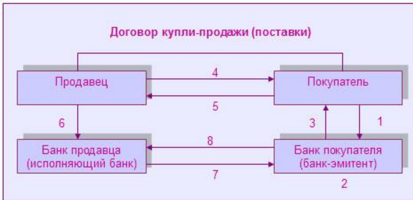
Схема расчетов с использованием депонированной чековой книжки