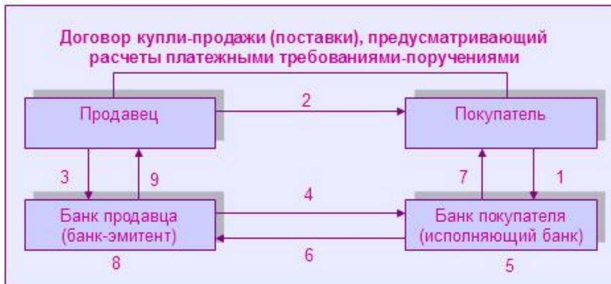
Схема расчетов с использованием безакцептных платежных требований или инкассовых поручений