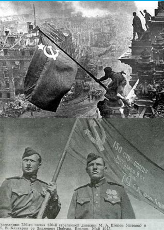
Лазаретники 756-го полка 150-й стрелковой дивизии М. А. Егоров (справа) и Г. В. Кантария со Знаменем Победы, Берлин, Май 1945.

На законодательном уровне Знамя Победы является «организационным символом Победы советского народа над фашистской Германией в Великой Отечественной войне 1941-1945 г. г.» и признано «государственной реликвией России».