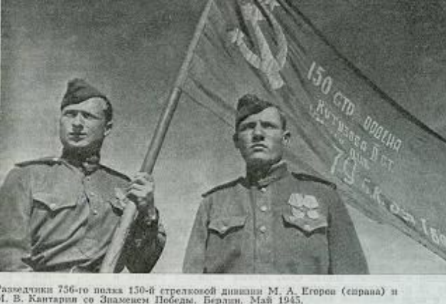
Лазаретники 756-го полка 150-й стрелковой дивизии М. А. Егоров (справа) и И. В. Кантария со Знаменем Победы, Берлин, Май 1945.