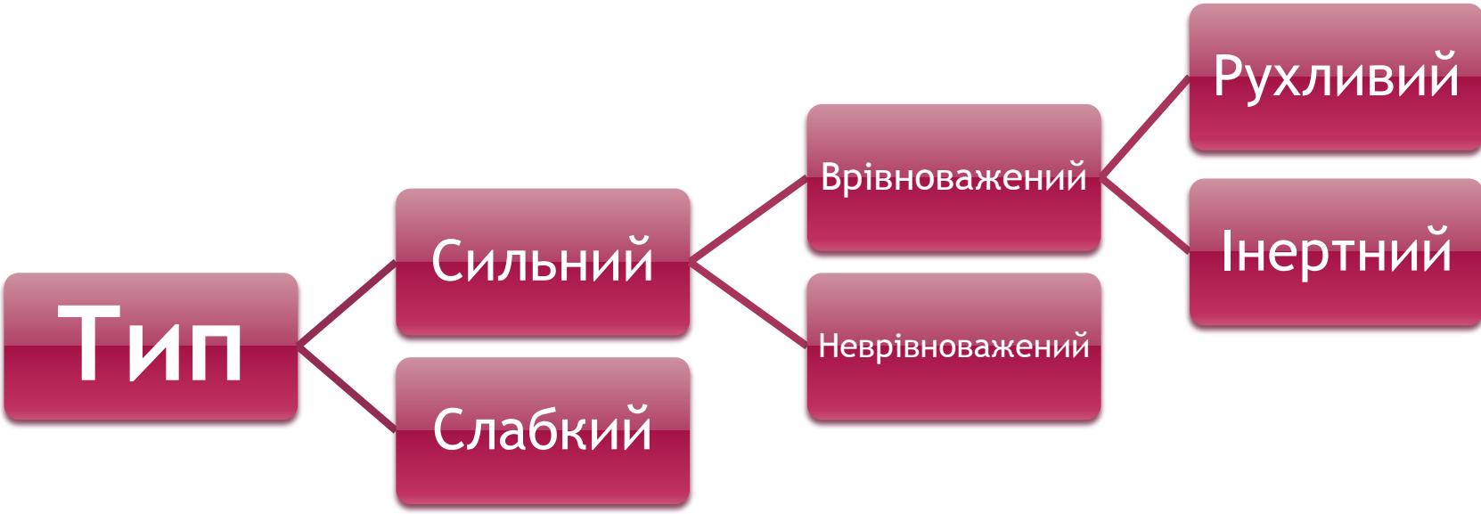
Типи нервової системи за І. П. Павловим