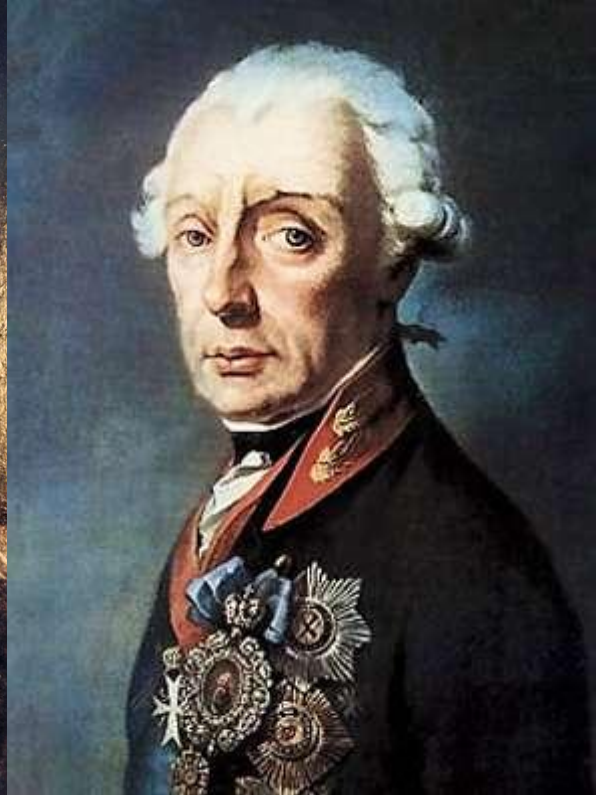
О. В. Суворов