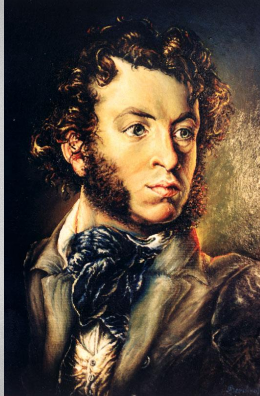
О. С Пушкін