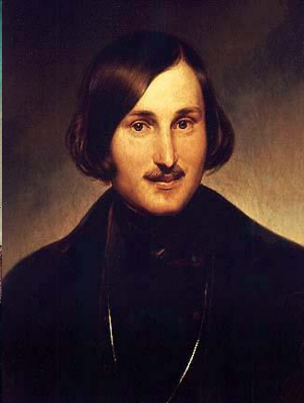
I. A. Крилов