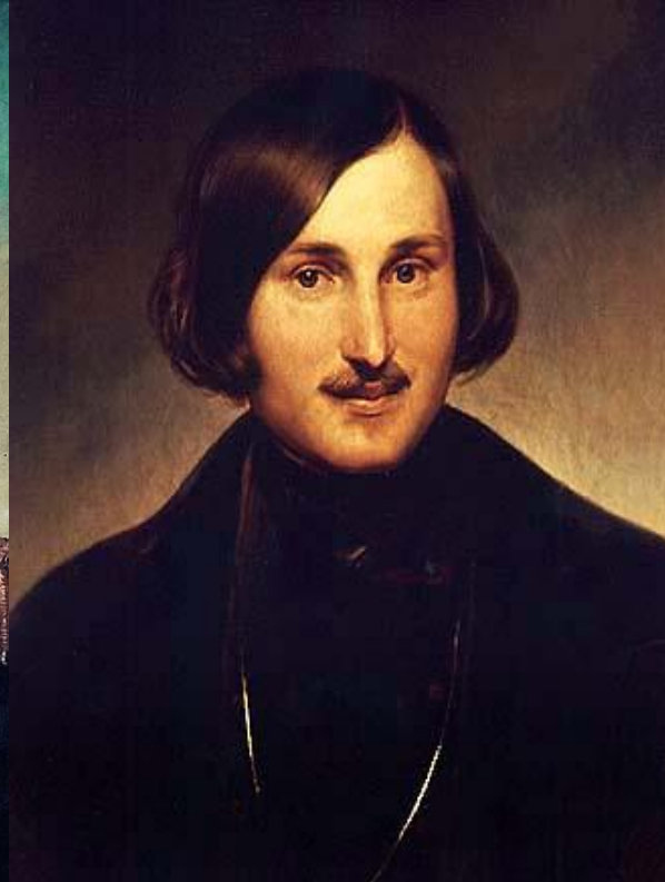
I. A. Крилов