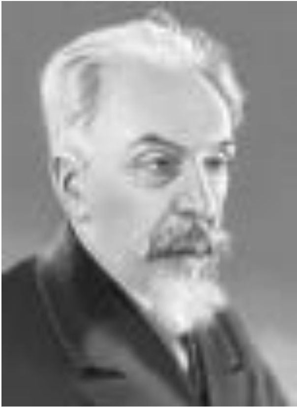
Лев Владимирович Щерба

Активный билингвизм может быть, в свою очередь, разграничен на "чистое двуязычие" и "смешанное двуязычие" (Щерба).