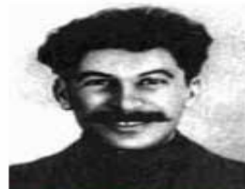
J. Stalin 1879-1953 General Secretary Cerebral Hemorrhage