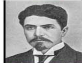
S. Shaumyan 1878-1918 Baku CPC Civil War