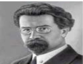
V. Nogin 1894-1926 CPC Natural causes