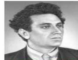
G. Zinoviev 1883-1936 Politburo Shot