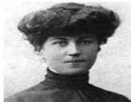
A. Kollantai 1872-1952 Ambassador Norway Heart Attack