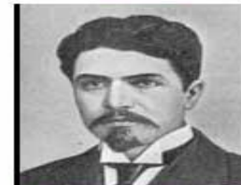
S. Shaumyan 1878-1918 Baku CPC Civil War