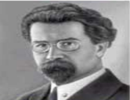
V. Nogin 1894-1926 CPC Natural causes