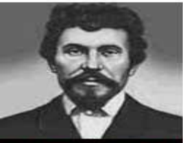
A. Rykov 1881-1938 Soviet Premier Shot