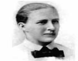
E. Stassova 1873-1966 Secretary CC Natural Causes