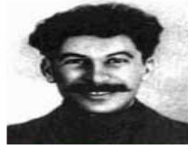
J. Stalin 1879-1953 General Secretary Cerebral Hemorrhage