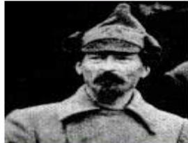
F. Dzerzhinsky 1877-1926 Comm. NKVD Heart Attack