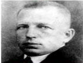
A. Bubnov 1883-1940 Directorate Red Army Died in prison