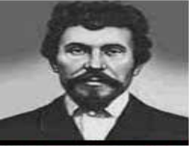
A. Rykov 1881-1938 Soviet Premier Shot