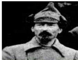
F. Dzerzhinsky 1877-1926 Comm. NKVD Heart Attack