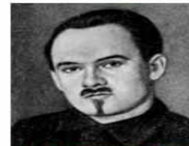
G. Lomov 1888-1938 VSNKh Shot