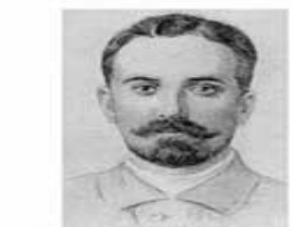
P. Dzshaparidze 1880-1918 Baku CPC Civil War