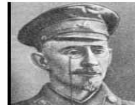
I. Smilga 1892-1938 Military Rev. Comm. Shot