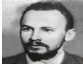
N. Bukharin 1888-1938 Politburo Shot