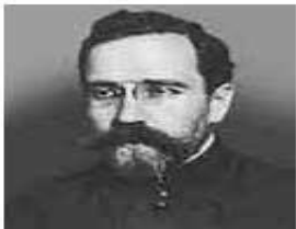
L. Kamenev 1883-1936 Chairman CC Shot