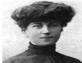
A. Kollantai 1872-1952 Ambassador Norway Heart Attack