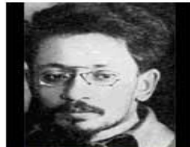
Y. Sverdlov 1885-1919 President CC Typhoid