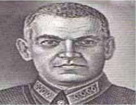
J. Berzin 1890-1935 NKVD Strangled