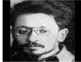
Y. Sverdlov 1885-1919 President CC Typhoid