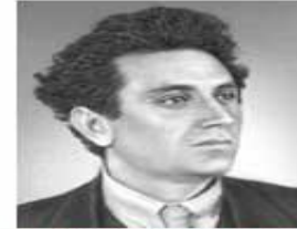
G. Zinoviev 1883-1936 Politburo Shot