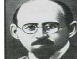
N. Krestinsky 1883-1938 Comm. Intl. Affairs Shot