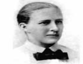
E. Stassova 1873-1966 Secretary CC Natural Causes