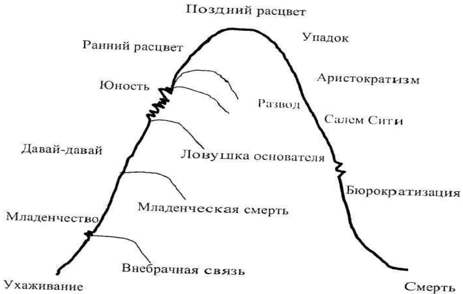
МОДЕЛЬ ЖИЗНЕННОГО ЦИКЛА ИЦХАКА АДIZESА