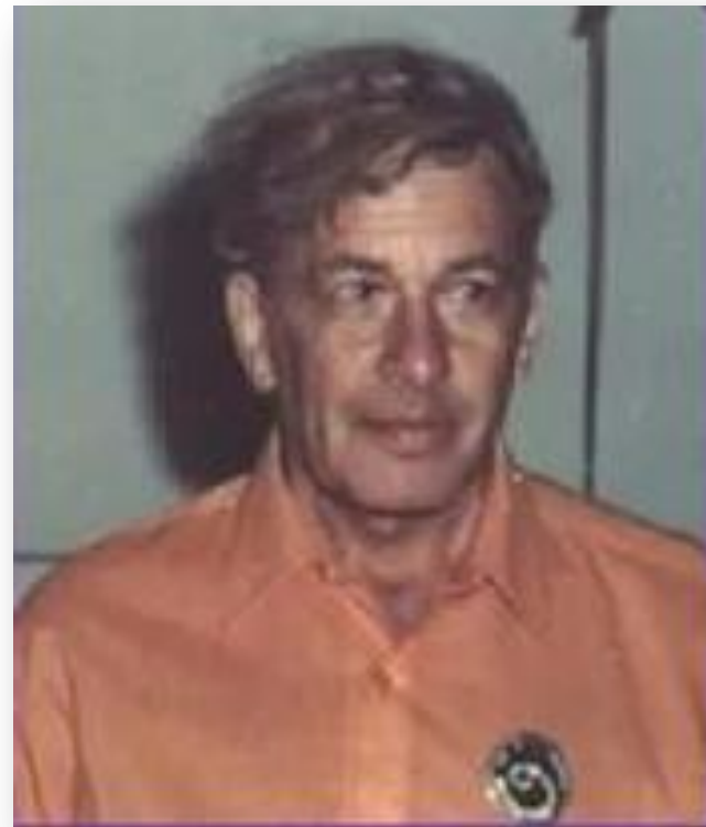
Генрихом Сауловичем Альтшуллером