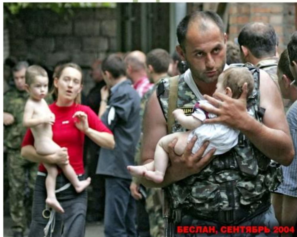
БЕСЛАН, СЕНТЯБРЬ 2004

Убит 31 террорист, 1 арестован и впоследствии приговорён к пожизненному заключению.