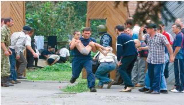
Беслан, сентябрь 2004 г.

Никто, к сожалению, не защищен от ситуации, когда может оказаться в заложниках у террористов