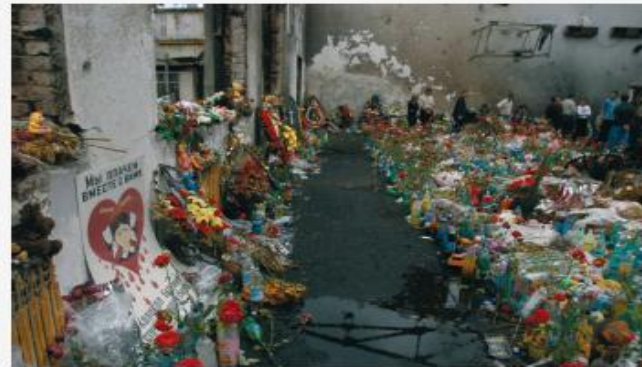
Беслан, сентябрь 2004 г.