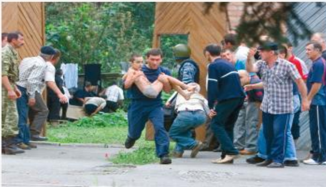
Беслан, сентябрь 2004 г.

Никто, к сожалению, не защищен от ситуации, когда может оказаться в заложниках у террористов