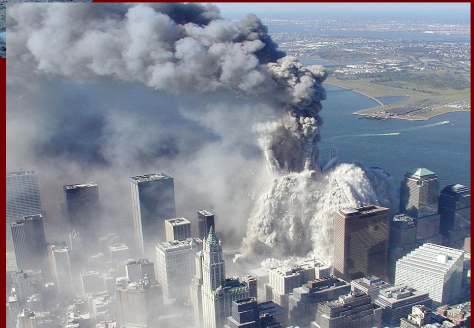
Вид сверху на развалины торгового центра.