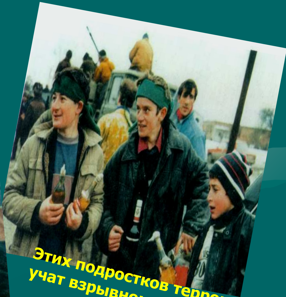
Этих подростков террористы учат взрывному делу