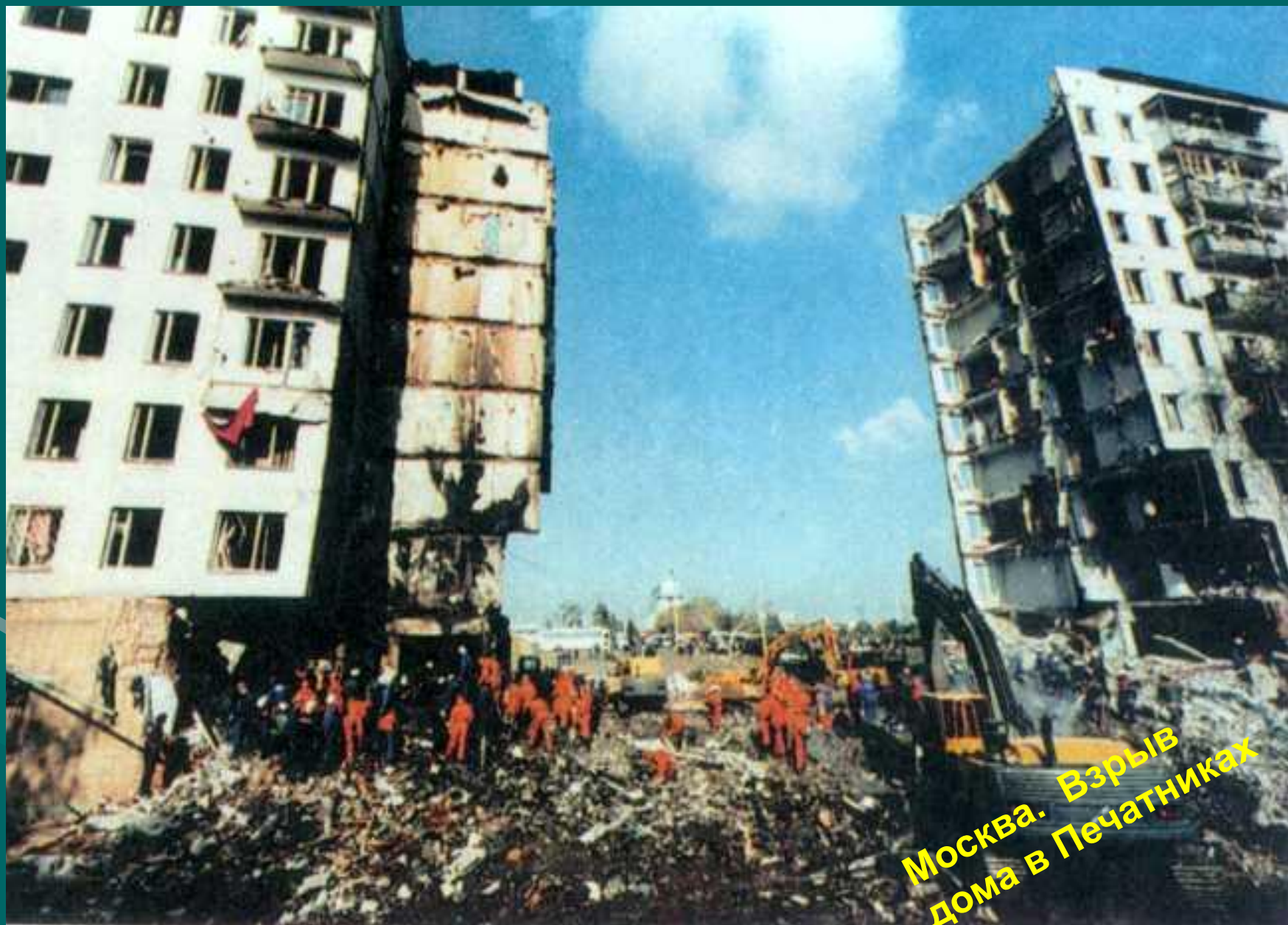
Москва. Взрыв дома в Печатниках