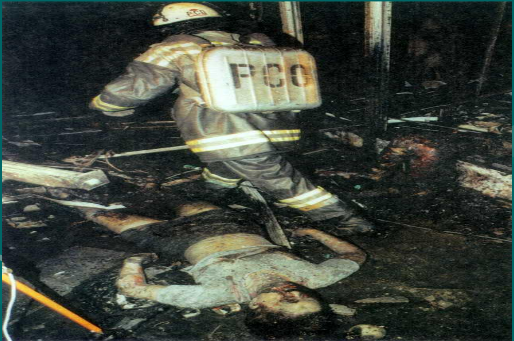
Москва. Пушкинская площадь. Трагедия 8 августа 2000 года