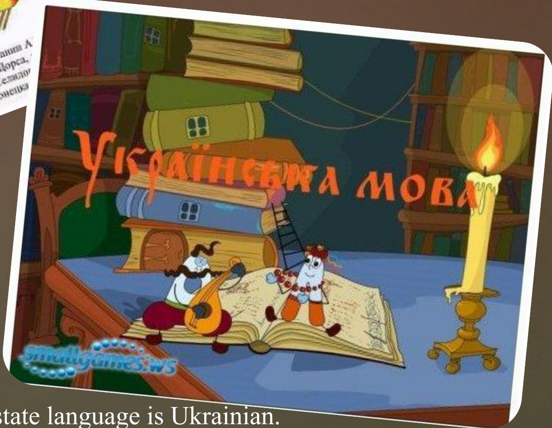
Ukraine is e republic. The state language is Ukrainian.