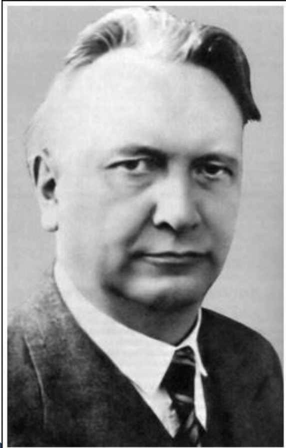
Карл Ясперс (1883–1969) — немецкий философ, психолог и психиатр, один из главных представителей экзистенциализма