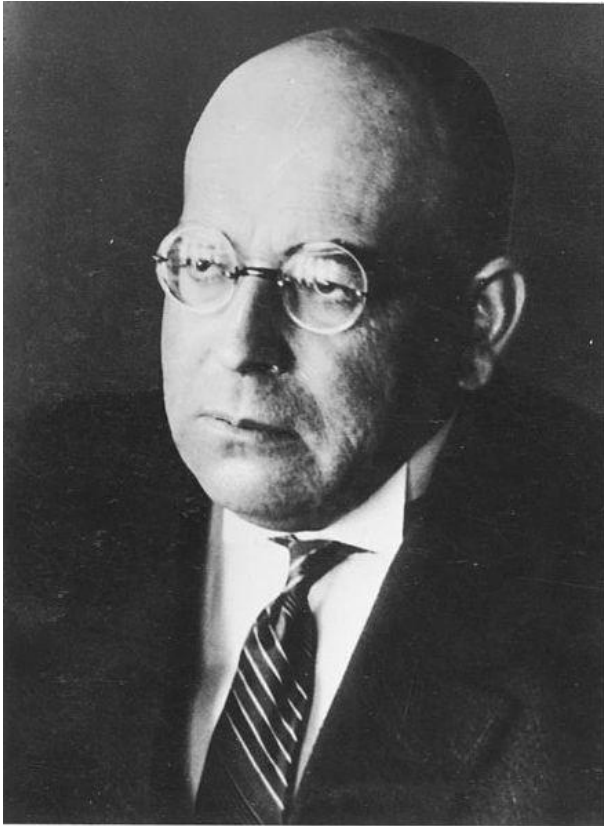
Освальд Арнольд Готтфрид Шпенглер (1880-1936) — немецкий философ-идеалист, представитель философии жизни, публицист консервативно-националистического направления

Циклическая (цивилизационная) концепция существования культуры – культурфилософская концепция, рассматривающая существование культуры как смену независимых друг от друга циклов, цивилизаций