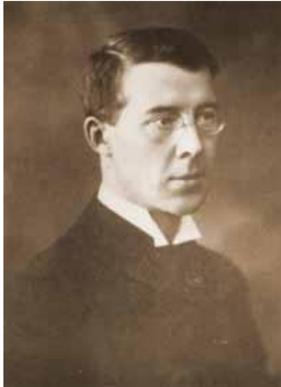
Пити́рим Алекса́ндрович Соро́кин (1889-1968) — российско-американский социолог и культуролог, один из основоположников теорий социальной стратификации и социальной мобильности

Культурные сверх (или супер) системы – органично сменяющие друг друга основополагающие фазы развития культуры, вбирающие в себя разнообразные культурные подсистемы и разнящиеся в зависимости от верховных ценностей