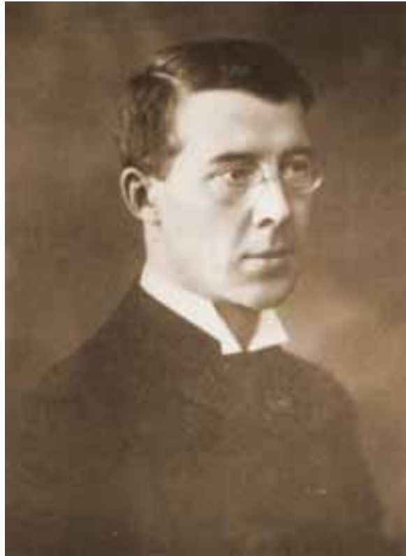
Пити́рим Алекса́ндрович Соро́кин (1889-1968) — российско-американский социолог и культуролог, один из основоположников теорий социальной стратификации и социальной мобильности

Культурные сверх (или супер) системы – органично сменяющие друг друга основополагающие фазы развития культуры, вбирающие в себя разнообразные культурные подсистемы и разнящиеся в зависимости от верховных ценностей