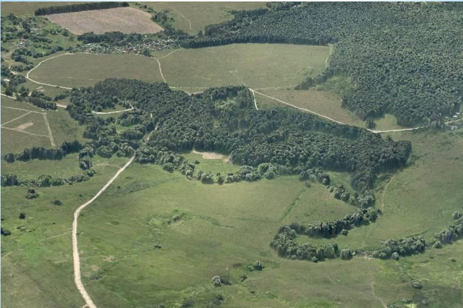
Трехмерная модель местности. Перспективный вид Заокский полигон МИИГАиК, под Серпуховым