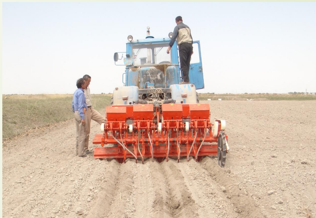
12-сурет – Индиялық сепкішпен күрішті жалға егу