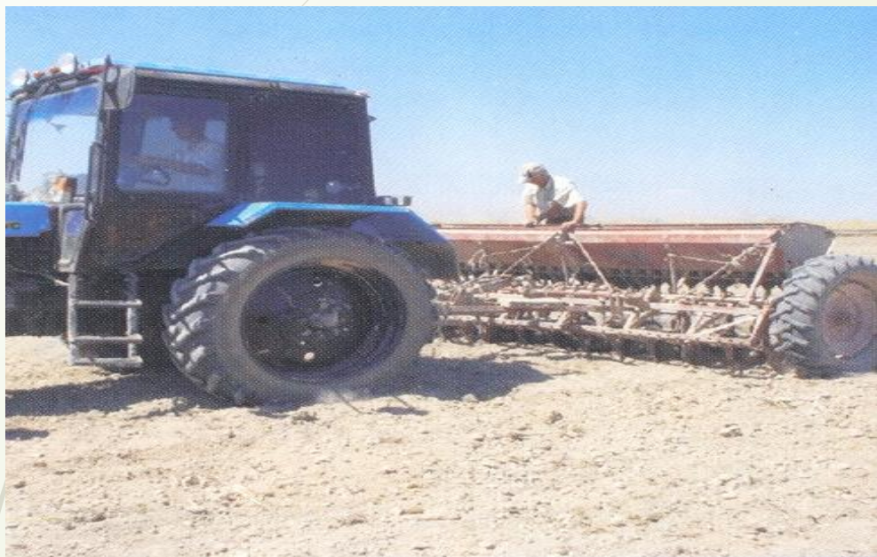
4-сурет – Дәстүрлі сепкішпен себу