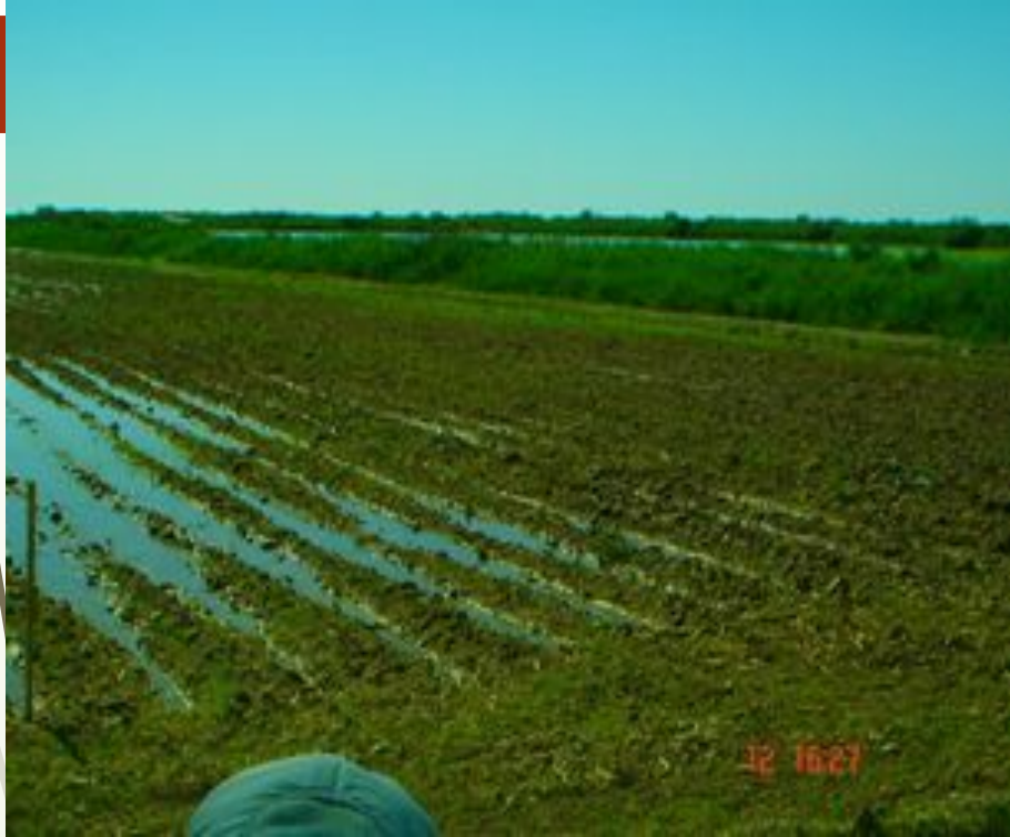
11-сурет – Күрішті жалға егу тәсілін қолдану кезіндегі алғашқы суға бастыру