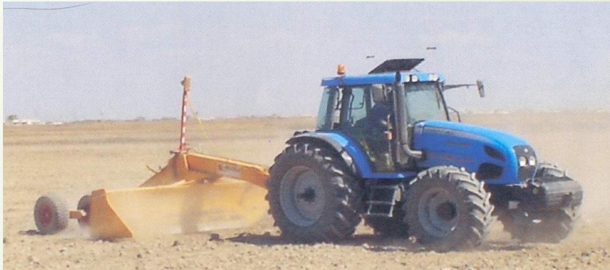
1-сурет - Күріш атызының бетін лазерлік тегістеу