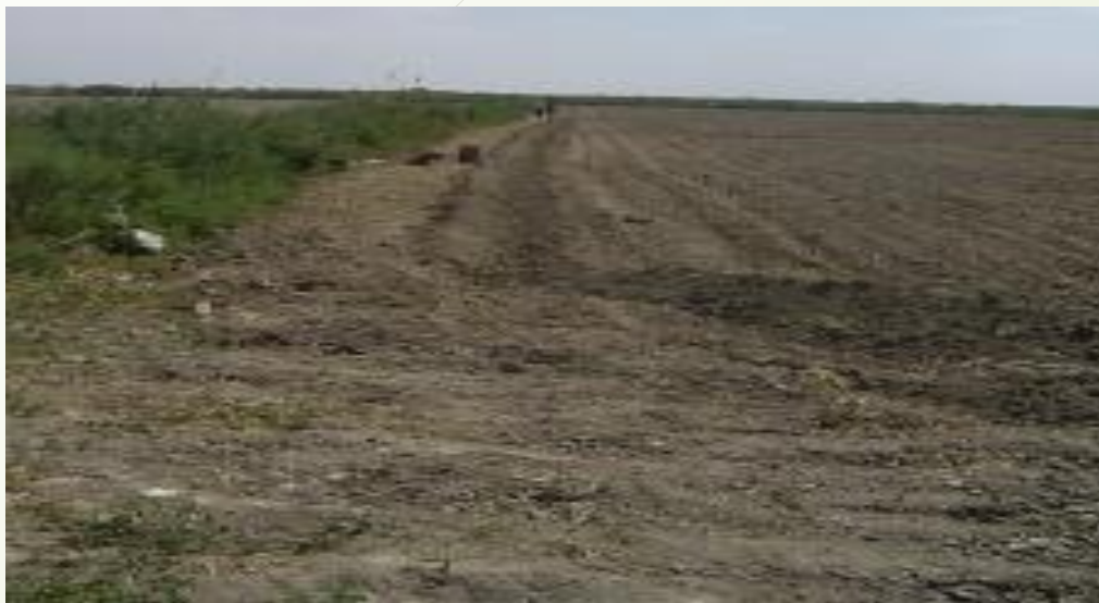
9 сурет – Атызды айналдыра арық салу