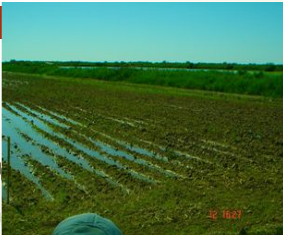
11-сурет – Күрішті жалға егу тәсілін қолдану кезіндегі алғашқы суға бастыру