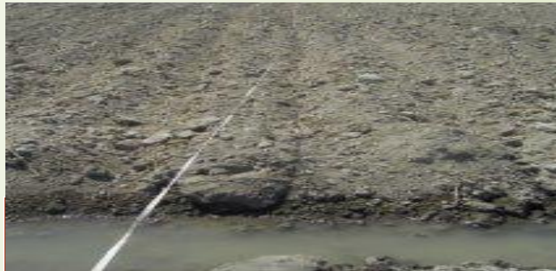
10 сурет – Уақытша салынған арықтарды суға бастыру