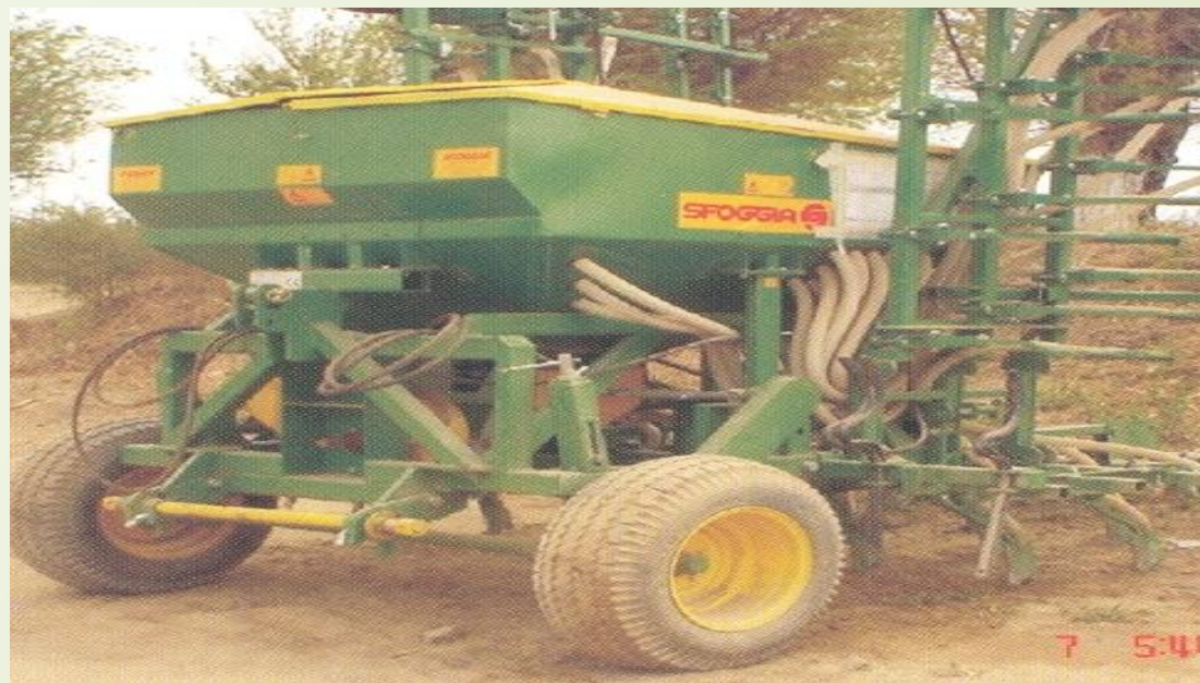
5-сурет – Екі дискілі минералды тыңайтқыш шашқыш