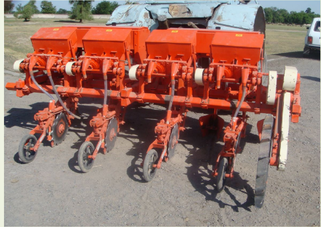
7 сурет – Жалдап себуге арналған индиялық сепкіш