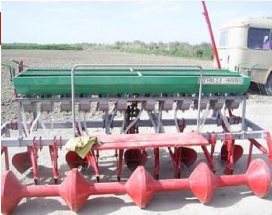
? 6 сурет – Қазақ су шаруашылығы ҒЗИ-ның сепкіші