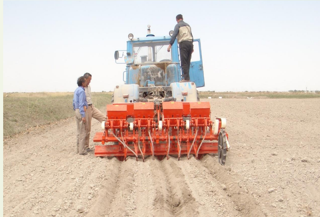
12-сурет – Индиялық сепкішпен күрішті жалға егу