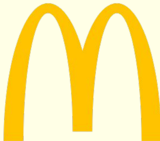
Эмблема сети фаст-фудов «McDonald's»