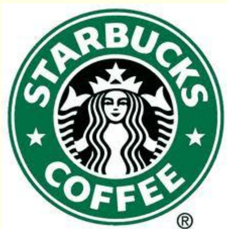
Эмблема сети кофеен «Starbucks»