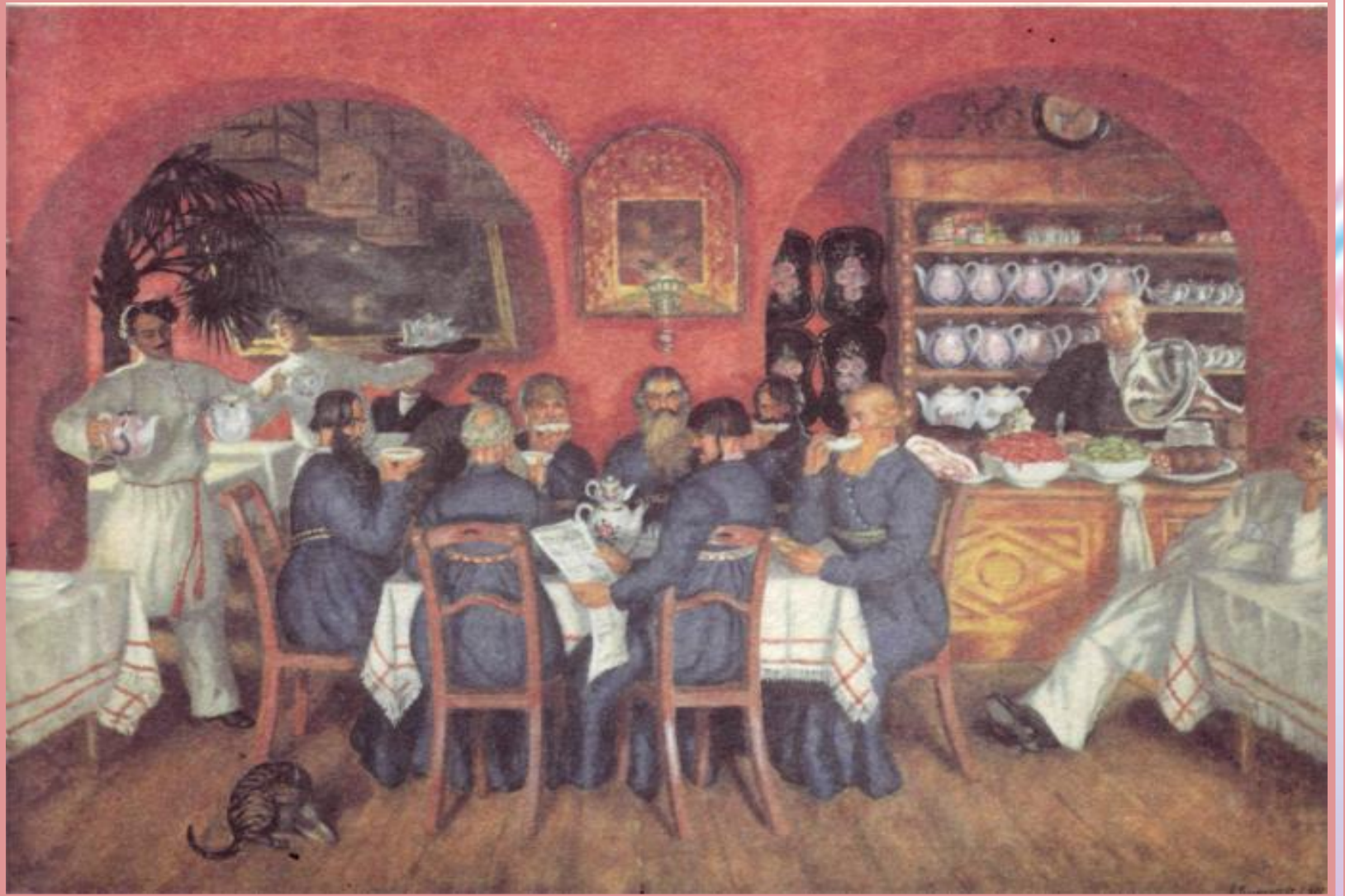
Б. Кустодиев. «Московский трактор»