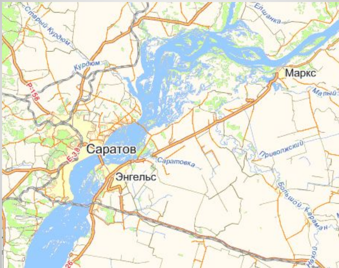
Ситуационный план трассы

Трасса по маршруту Саратов – Энгельс - Маркс. Масштаб карты 1 см – 6 км. При выборе воздушных способов строительства ВОЛС предложить вариант расположения опор. Рассмотреть организацию перехода через реку Волга.