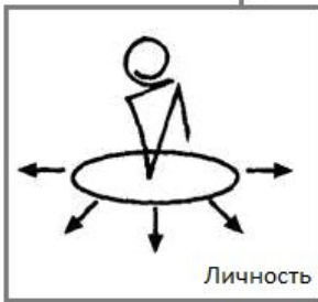
Таблица планов анализа

Анализ для вступления в должность: - включение в место - отношение включенности - вхождение в группу - противопоставление организации (в случае начальника)