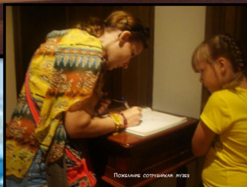
Пожилые сотрудники музея