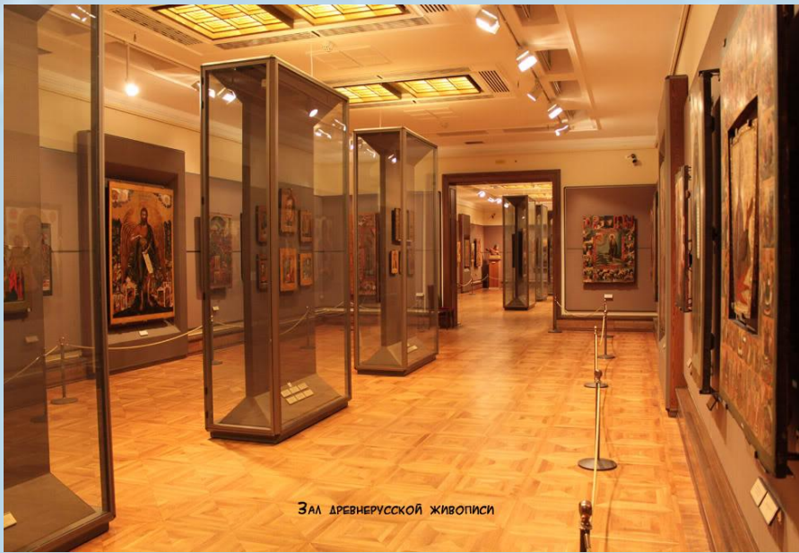
Зал древнерусской живописи