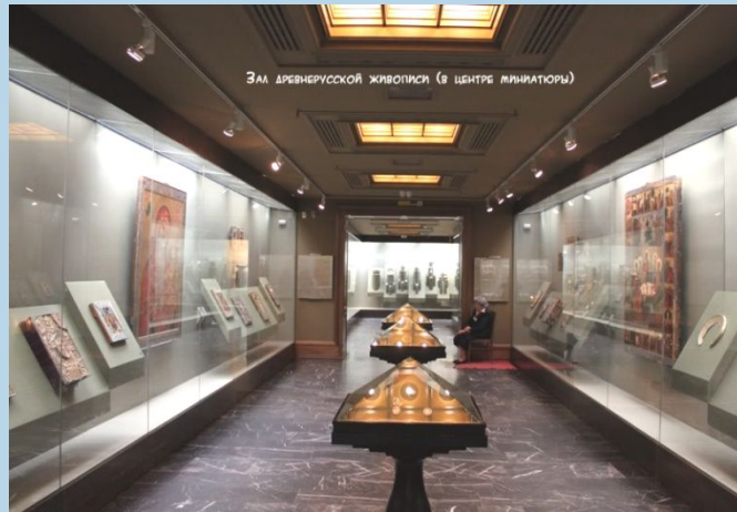
Зал древнерусской живописи (в центре миниатюры)