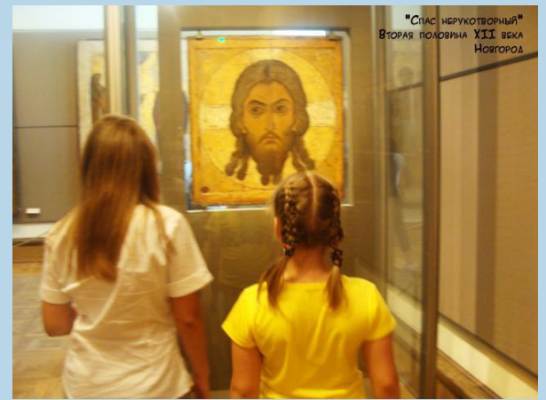
"Спас нерукотворный" Вторая половина XII века Новгород