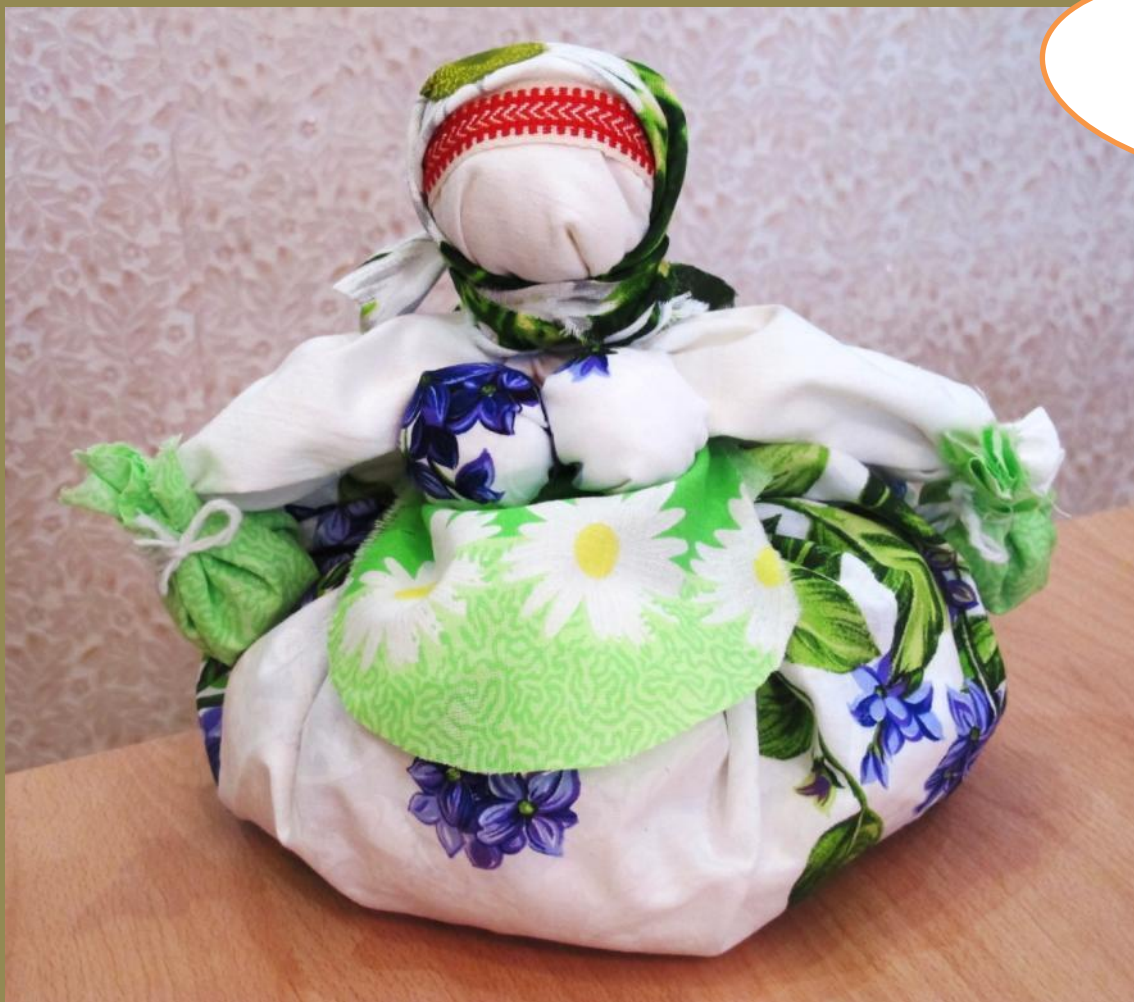
Кубышка - травница