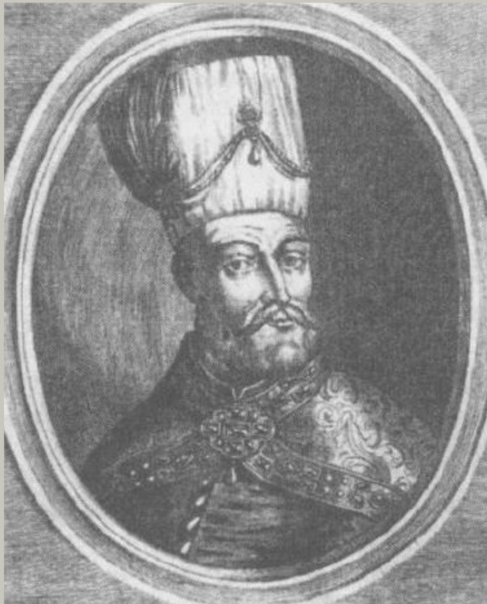
Прозвище – «Тараруй» - пустомеля