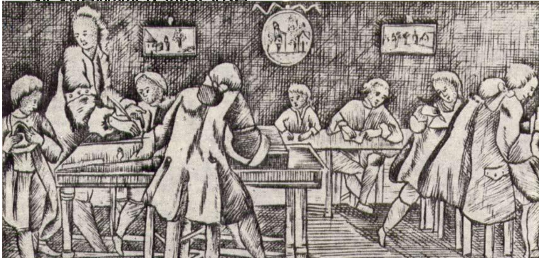
Обучение в Славяно-Греко-Латинской Академии

Усовершенствование системы образования и просвещения: 1685 (1687) - открытие Славяно – греко – латинской академии в Москве