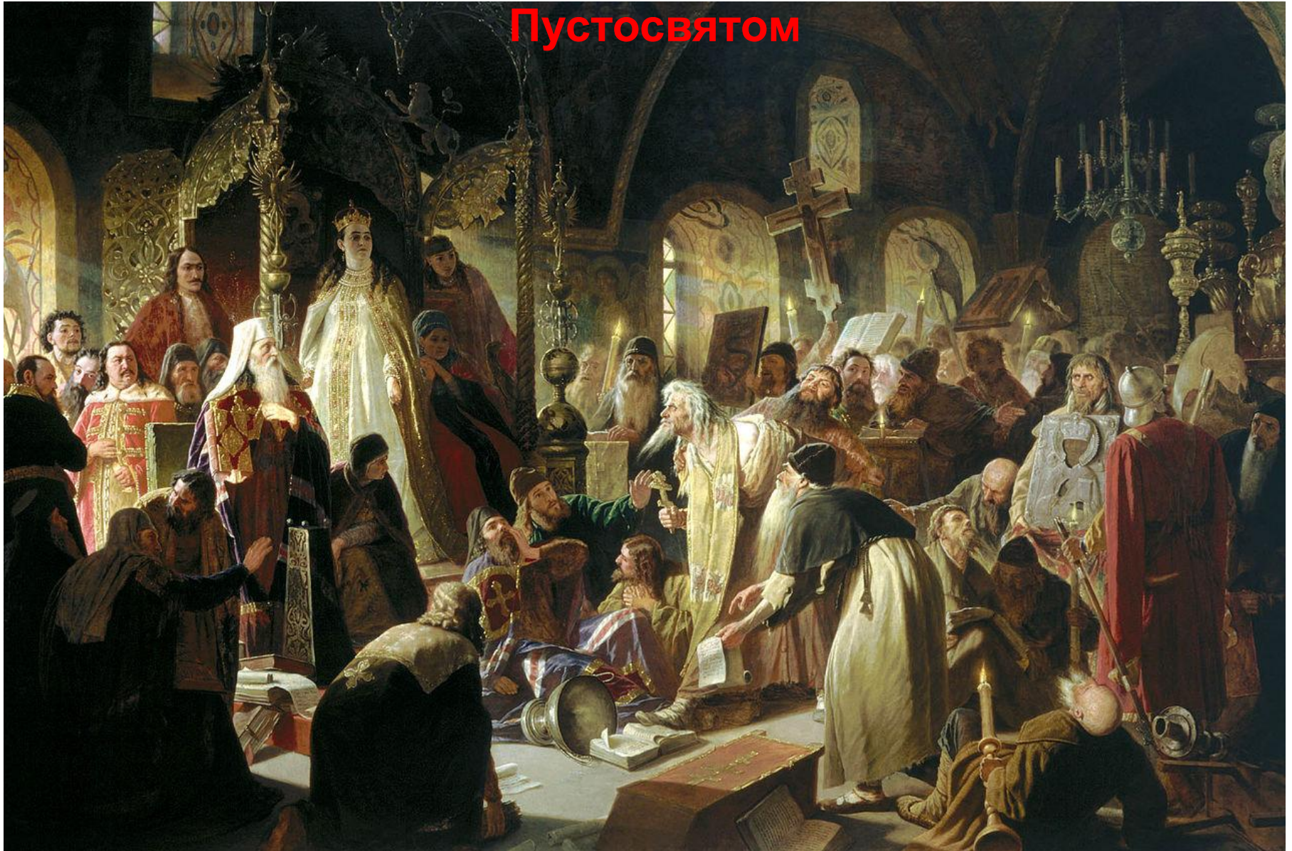
Василий Перов. Никита Пустосвят. Спор о вере («прения о вере»). 1880-81.