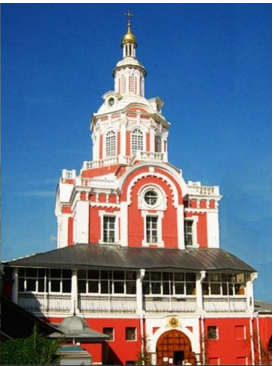
«Заиконоспасский монастырь - Славяно-Греко-Латинская Академия. Дом торговый»