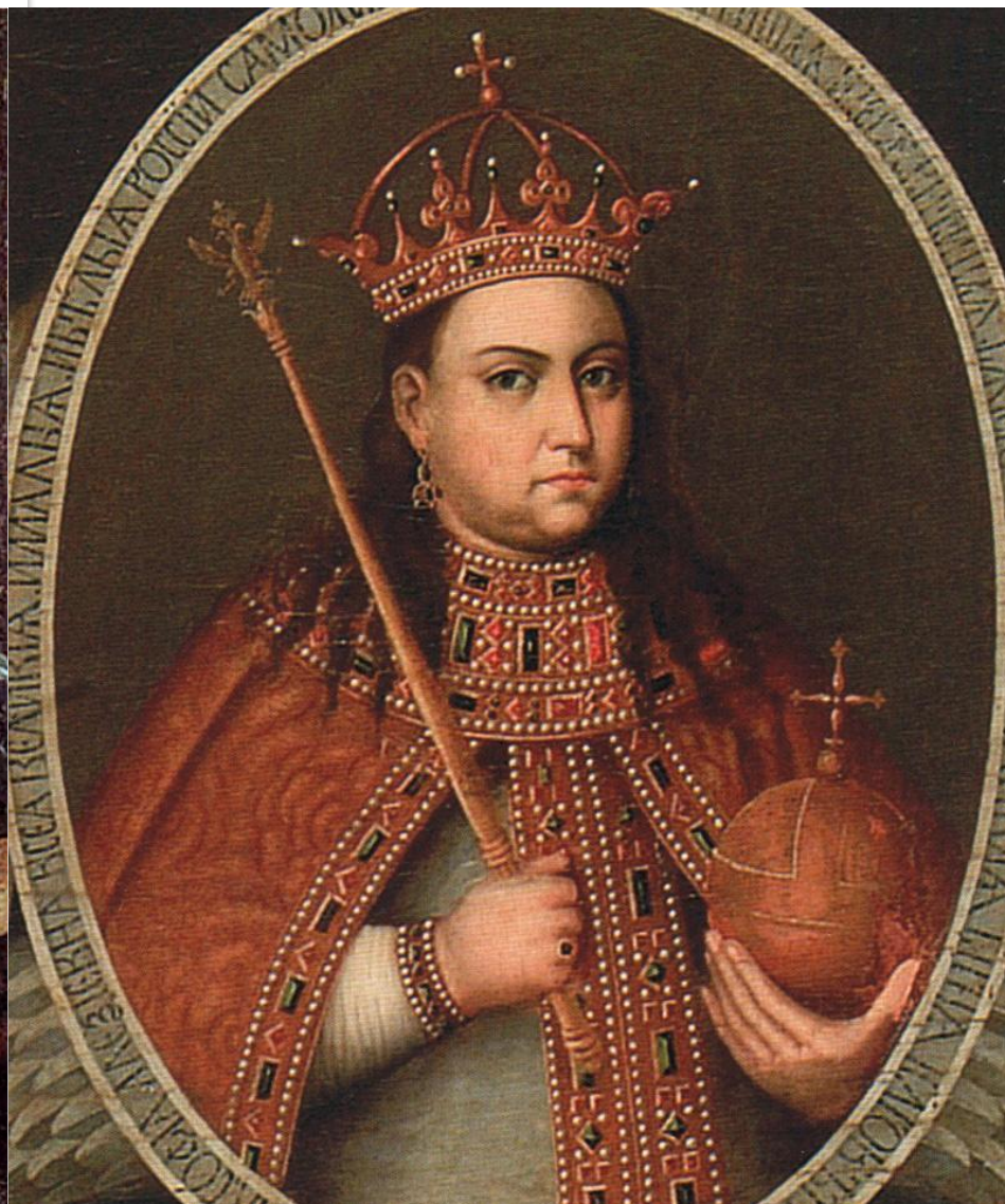
ВАСИЛИЙ ГОЛИЦЫН И СОФЬЯ