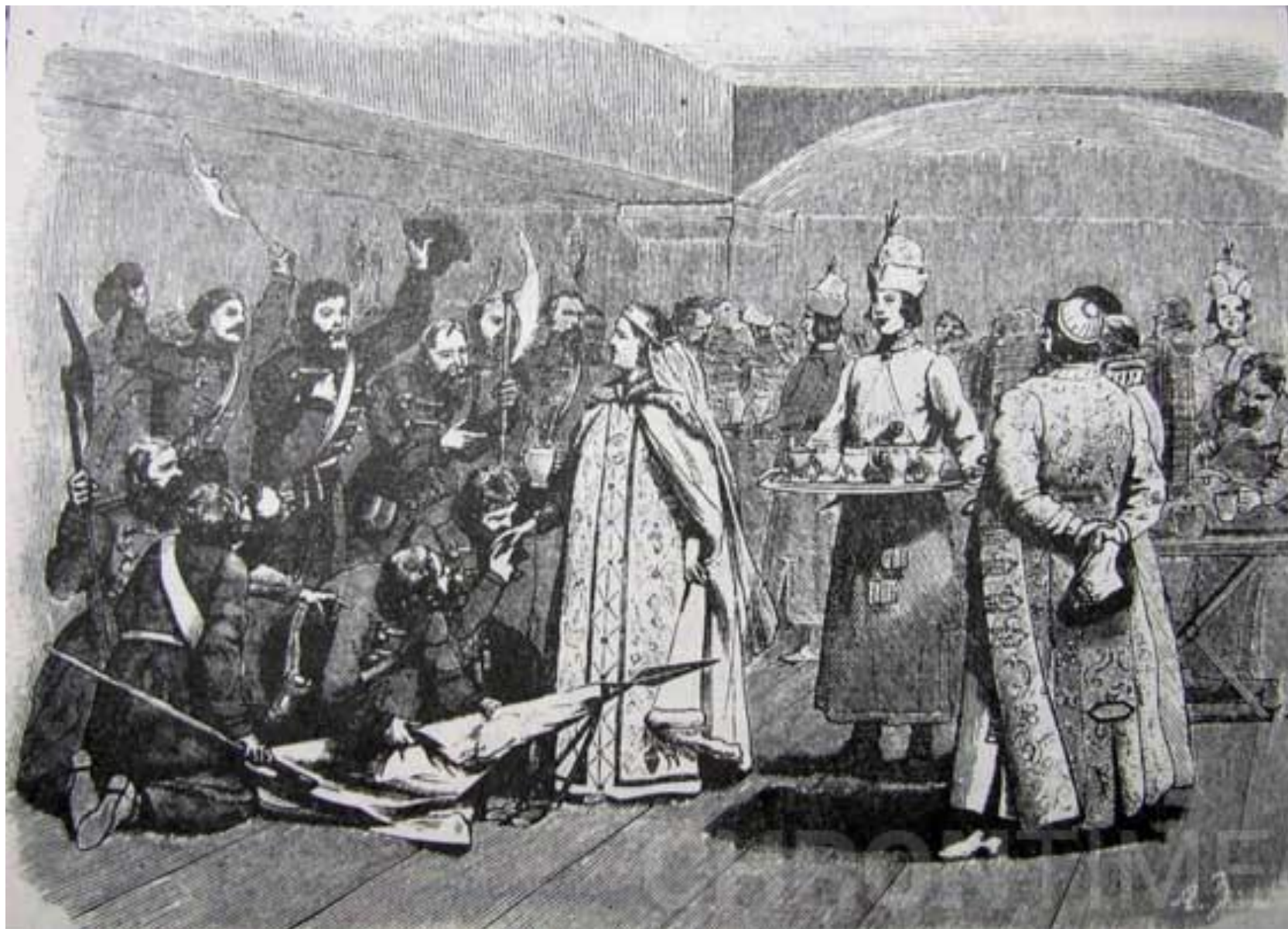
Царевна Софья угощает стрельцов. Гравюра XIX века

Правительство вынуждено выполнять эти уничижительные требования