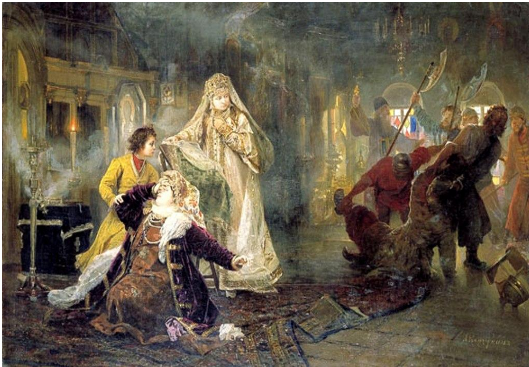
Михаил Долгорукий, Артамон Матвеев, Афанасий и Иван Нарышкины, боярин Языков, князь Григорий Ромодановский были убиты стрельцами.