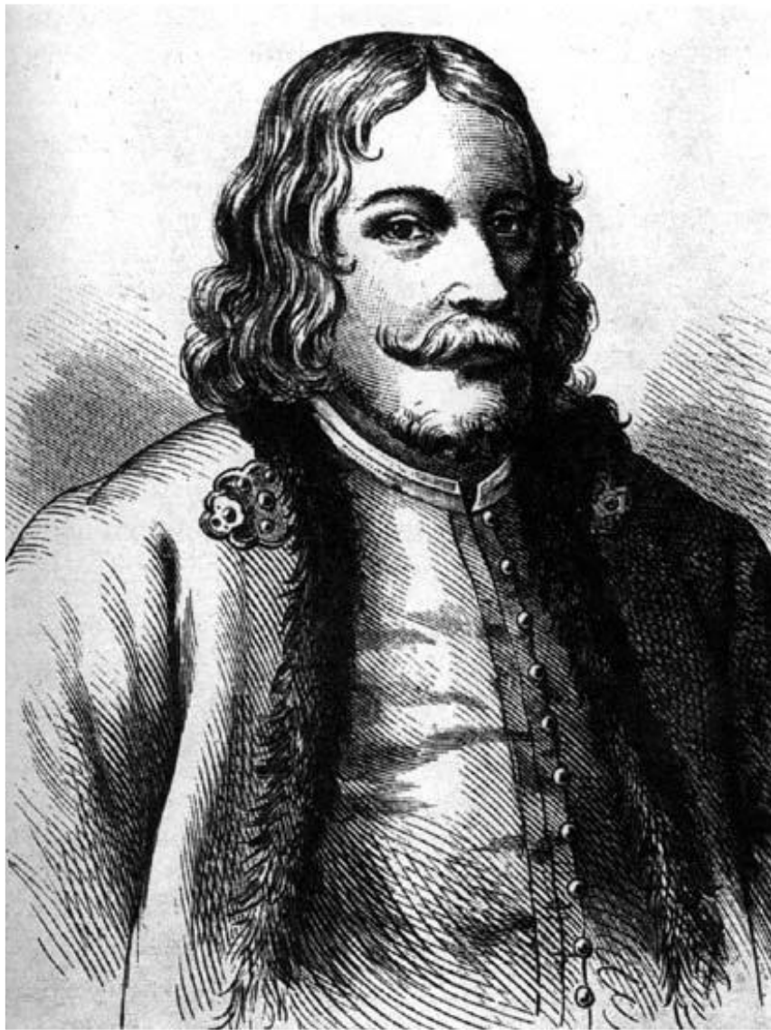
Князь Василий Андреевич Голицын

Один из европейских посланников так описывал Голицына: