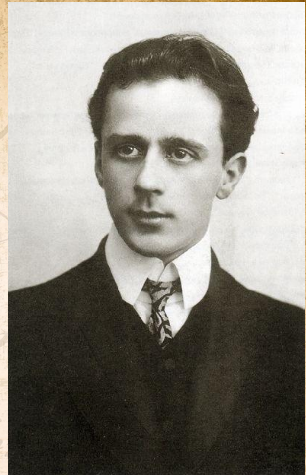
Михаил Михайлович Фокин

Афиша к первым «Русским сезонам» в Париже (1909)